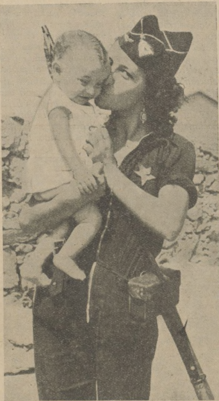
Antes de salir para el frente, donde lucha con su compañero, esta simpática miliciana da un último beso a su nena, que queda a cargo de su abuela.

(Palabras del discurso de Bernardette Cattaneo.)