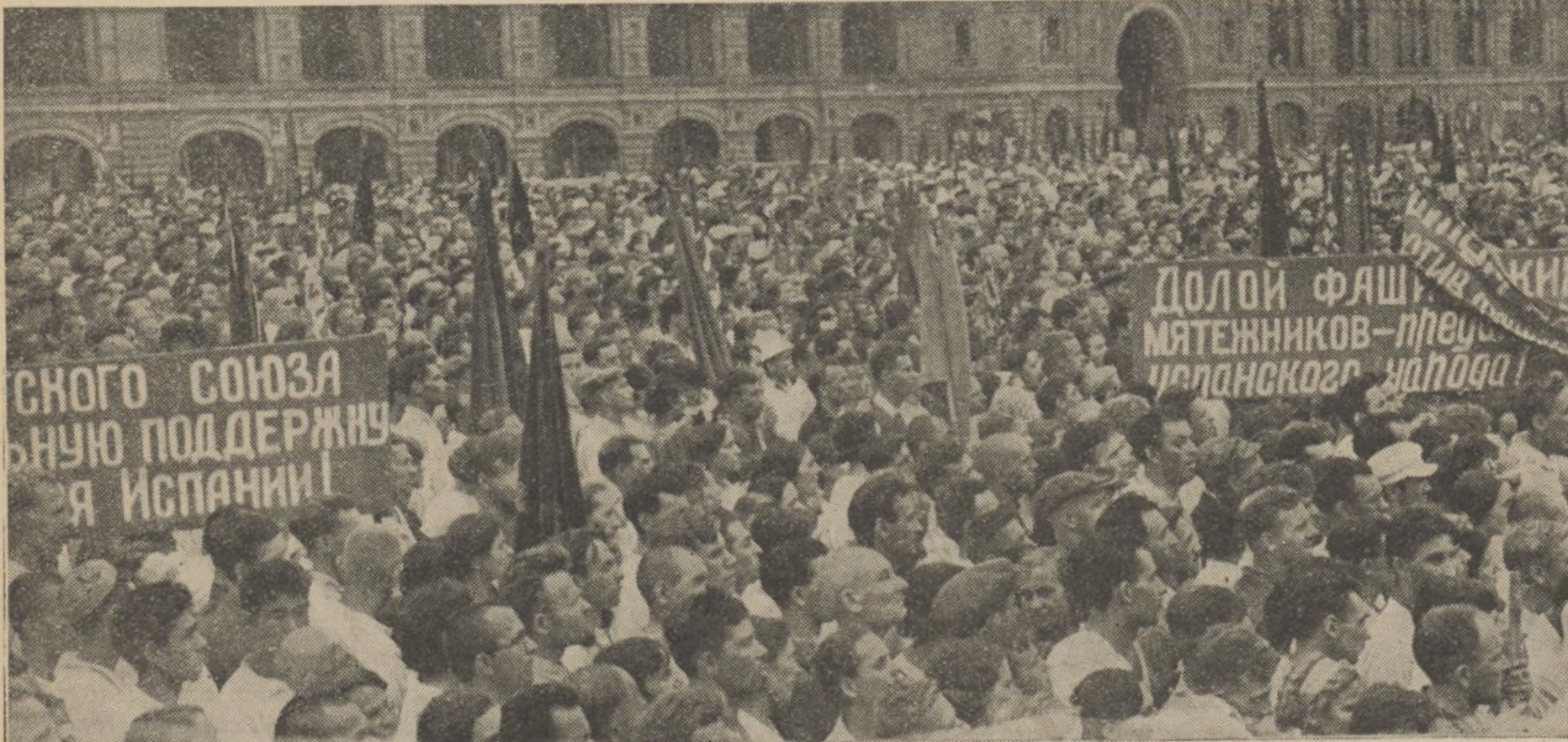
«¡Abajo el fascismo asesino!» «¡Mueran los traidores del pueblo español!» En una gran manifestación, nuestros hermanos de la U. R. S. S. exteriorizan con estas frases su solidaridad para nuestra lucha.