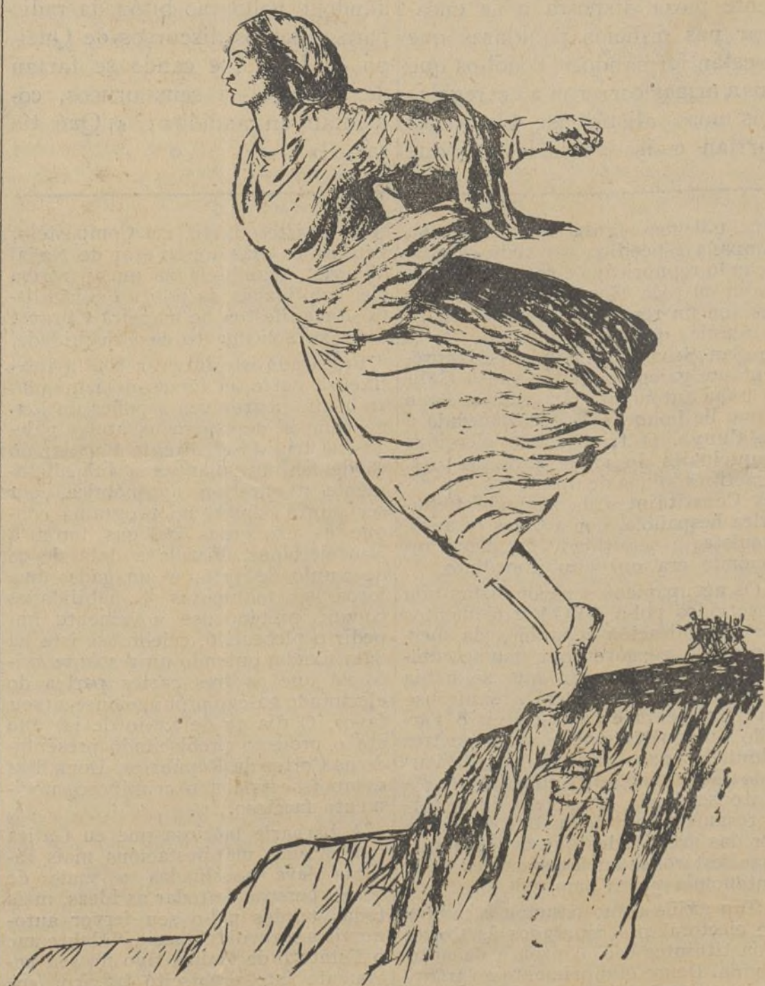
PRIMEIRO MORTA QUE ALDRAXADA