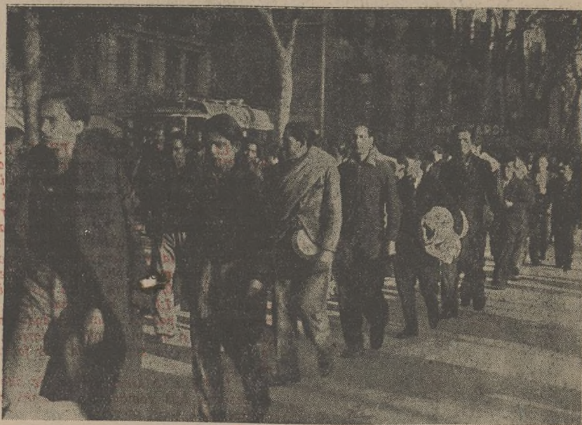
Batallons de voluntaris. La joventut en marxa. Cada moviment és un pas més cap a la total alliberació de la Pàtria. Els voluntaris sabran repetir la gesta de 1808. Com aleshores, l'invasor de la nostra terra haurà de sucumbir davant l'empenta dels nostres voluntaris.

J O V E S COMBATENTS CATALANS! CAPACITEU-VOS PER A LES N O V E S PROMOCIONS DE QUADRES DE COMANAMENT ! INGRESSEU A LES ESCOLES DE GUERRA !