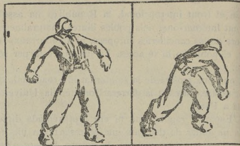
Presa de possessió.