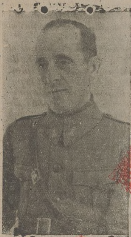
Comandante López Eguilaz

plosiones y otros trabajos, que dieron un resultado positivo. Se realizaron ciertas tareas y se sacaron experiencias del funcionamiento de materiales que tanto han de servir, luego de estudiadas concienzudamente, para las jornadas de prueba que posiblemente atravesará el Ejército del Centro.