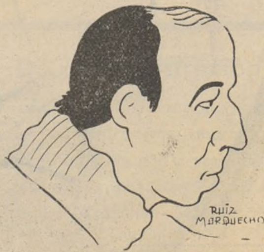
El Presidente del C. P. de Asistencia Social