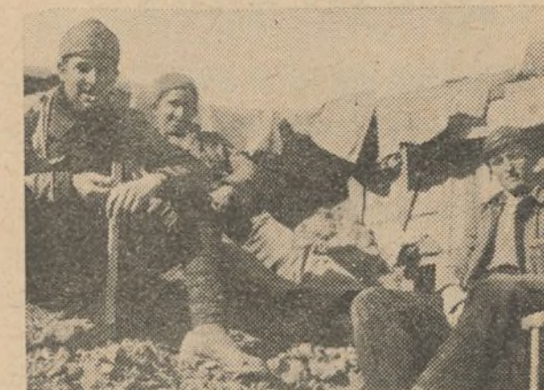
Milicianos descansando después de un combate