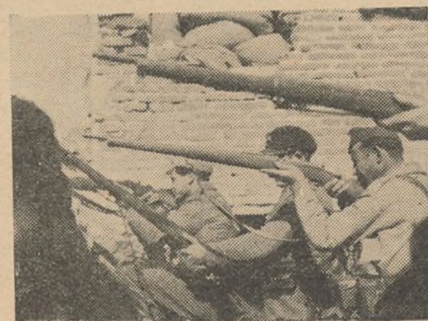
Milicianos haciendo fuego sobre el enemigo

Los fortificadores, hombres maduros de encallecidas manos, héroes anónimos que exponen sus vidas por tener protegidas las de los combatientes, cavan en silencio, transportan materiales y agitan sin cesar sus instrumentos de trabajo. Han dejado sus chaquetillas sobre el lomo de la protección de las trincheras, y en