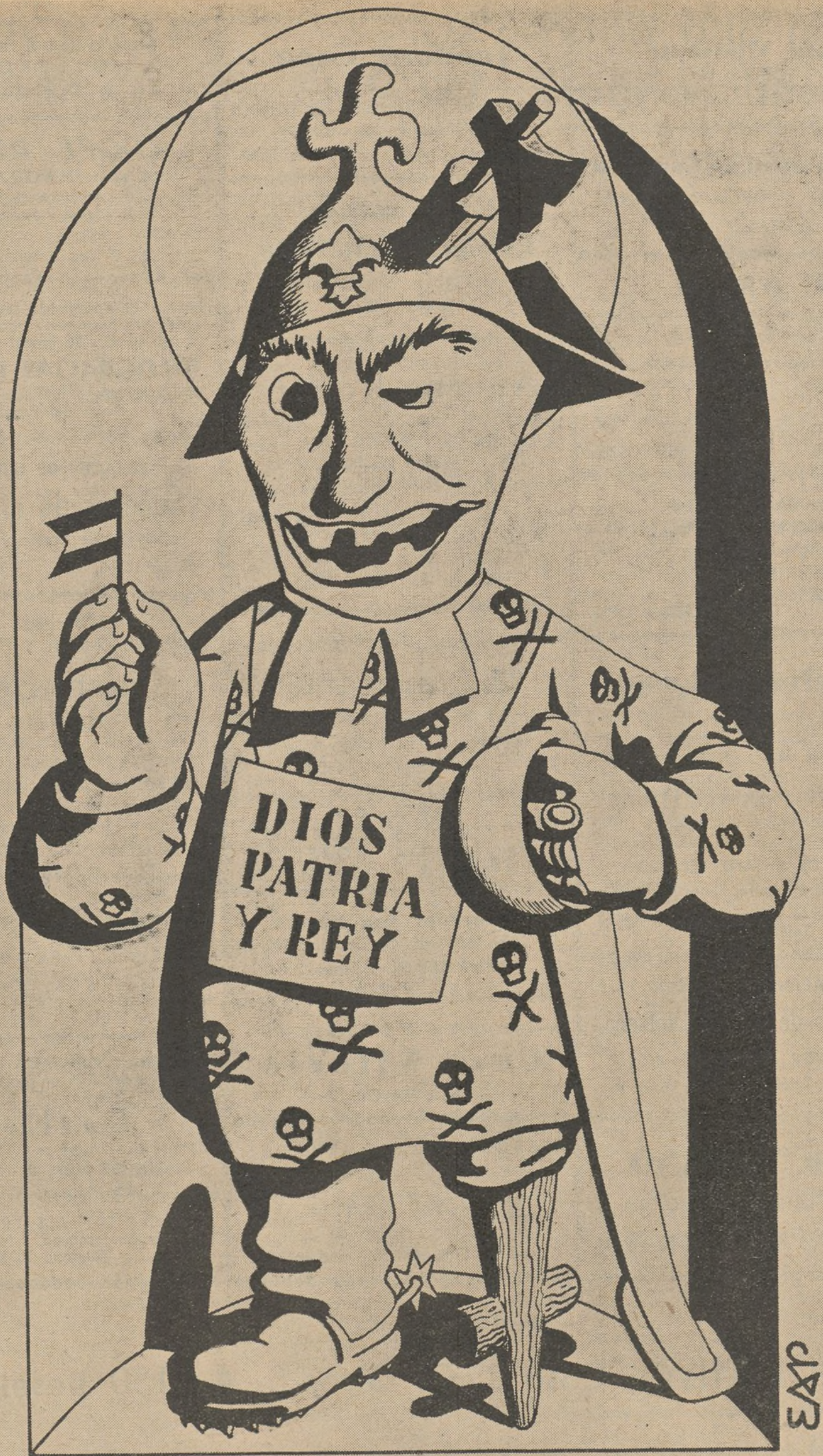
SAN FACCIOSO VIRGEN Y MARTIR