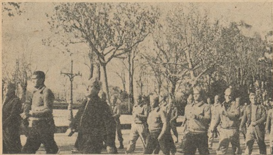
El "Batallón Azaña" desfilando por Valencia

Tras de unirse los republicanos jóvenes, vendrá la Alianza Nacional Juvenil, y, tras de ésta, la fortaleza del antifascismo, que nos hará sentir con fuerza y cercana la victoria sobre los sublevados y sus secuaces.