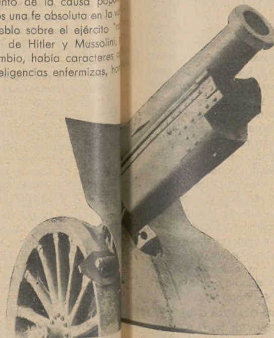
ARTILLERÍA DE LA REPÚBLICA. En las concentraciones fascistas. Él y sus servicios cercanos.

defensores, que la esperaban hacía tiempo con inusitada vehemencia, difícil de contener por sus jefes, se lanzaron a un ataque tan arrollador e impetuoso que, a las pocas horas de empezar, eran dueños de las mejores posiciones que tenían los facciosos defendiendo Oviedo y de la mayoría de las calles de esta población.