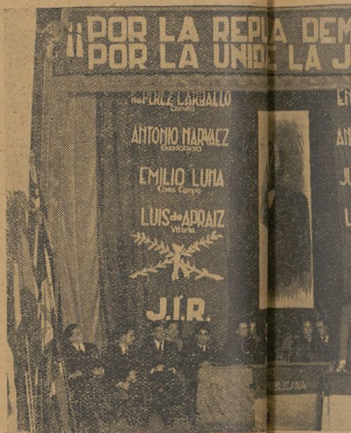
Aspecto del escenario de la J.