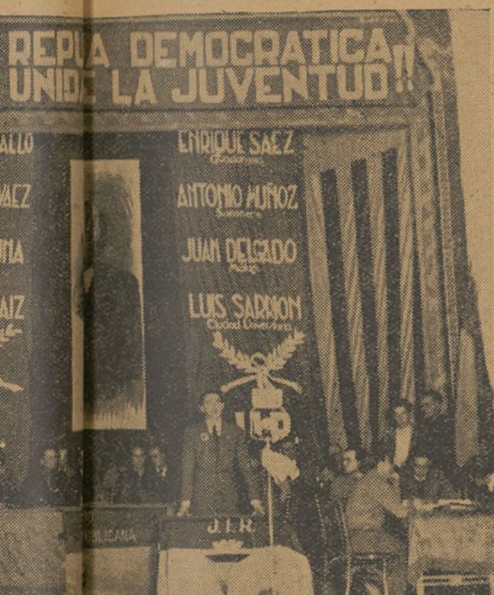
Escenario del acto de la J. I. R. en Valencia

e pro- tancias amente licanis- s jóve- armen- a posi- e sien- coloca e punto de Go- es re- ra qué de des- España. os pro- situa- juventu- plo de e sentir