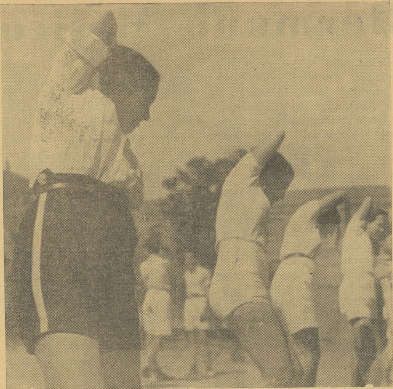
Ejercicios gimnásticos, ejecutados en las clases de Cultura Física que ¡ALERTA! tiene instaladas en Serrano, 25

La República, generosa con exceso, no llevó a cabo la revolución que tenía que hacer en las costumbres, en