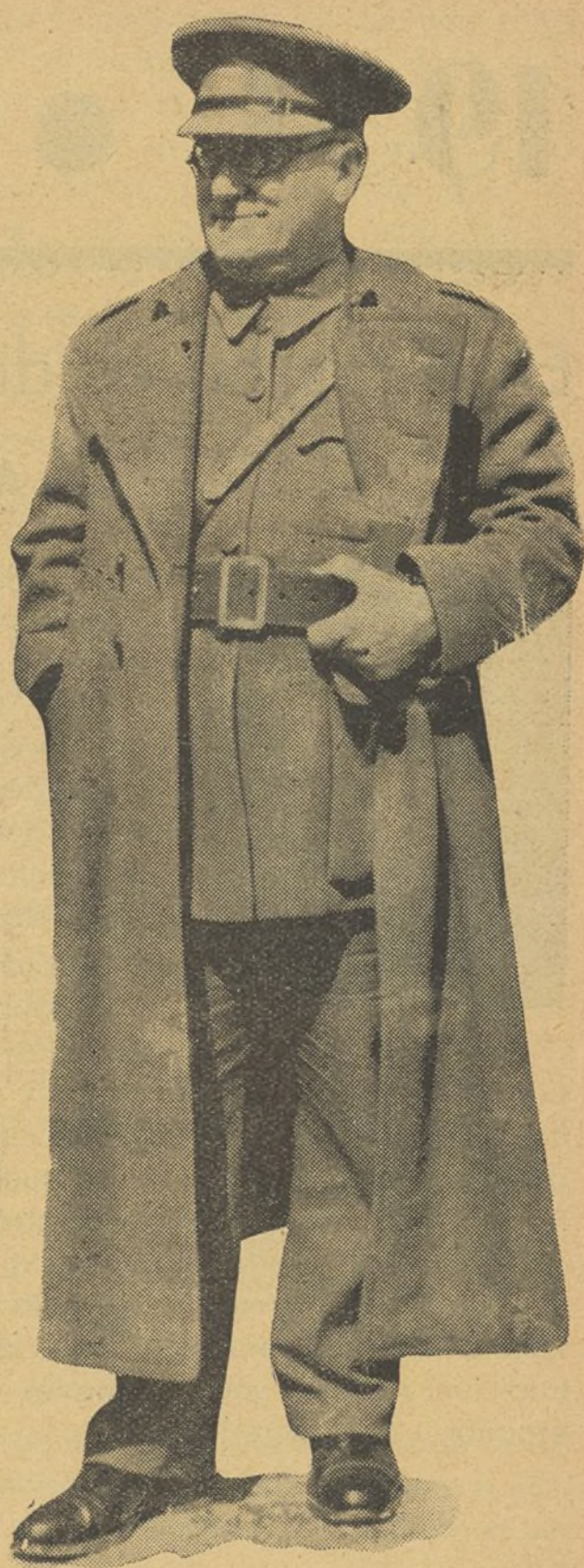
El ilustre general Miaja, a quien ha sido concedida la Gran Cruz Laureada, por la heroica defensa de la capital de la República

Regresamos llenos de satisfacción. Hemos podido apreciar a través de la charla sostenida con el Comisario