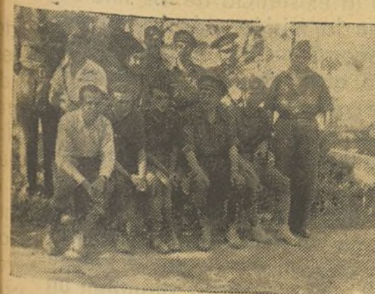
Algunos oficiales y comisarios de la J. I. R. en el frente del Centro

alegría, producto del convencimiento de la razón de nuestra lucha, una moral elevadísima, también nacida de esta razón, pero aumentada y sostenida por la labor constante, inapreciable, de los comisarios políticos, complemento formidable e inseparable, de los mandos leales y artífices destacados de la Victoria.