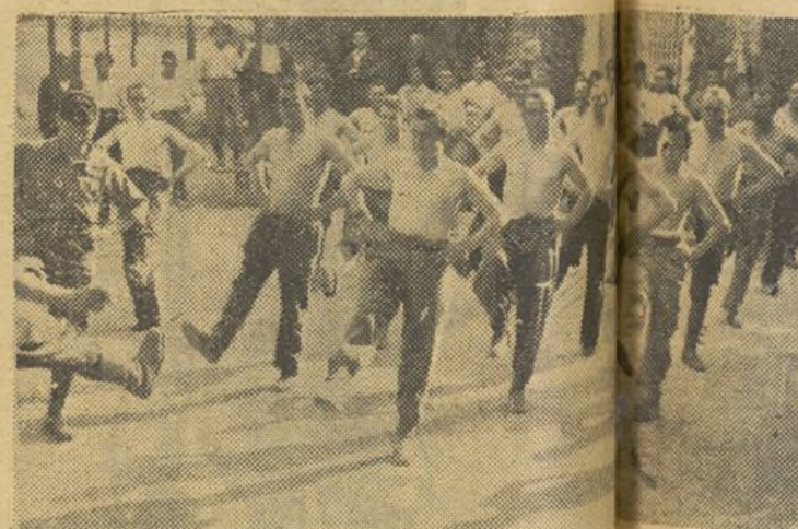
Muchachos del Batallón Madrid haciendo gimnasia

En nuestra visita a uno de los batallones que forman la barrera de disciplina, que al predicar con el ejemplo se ganan la simpatía y el respeto la cual se han venido estrellando de sus muchachos, que no los miran ataques facciosos, el que mandan como signo de imposición, sino como camaradas más instruidos militarmente a nuestro correligionario y por tanto capaces de llevarlos a la victoria. Un solo caso, oído a unos milicianos antífica de todos sus componentes de paso en Madrid, dará claramente