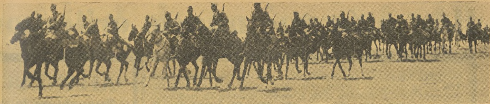
Un desfile de fuerzas de Caballería, del Ejército Popular