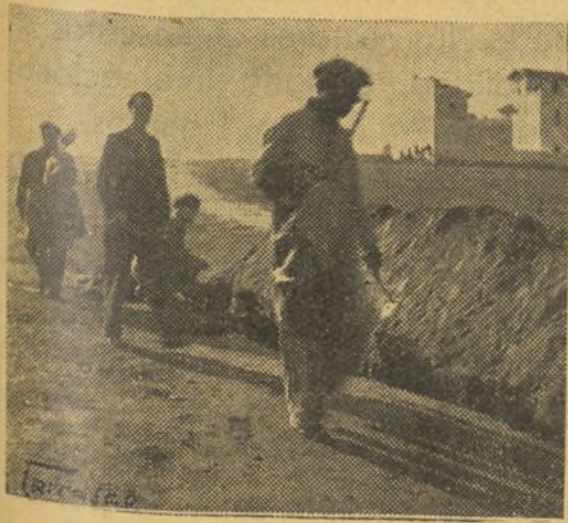
Obreros de fortificaciones en la última avanzadilla.