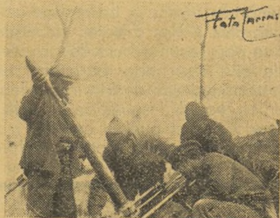
Un mortero disparando en el frente

La aviación ha bombardeado objetivos militares de Zaragoza y otras poblaciones, efectuando vuelos de reconocimiento en los diversos frentes.