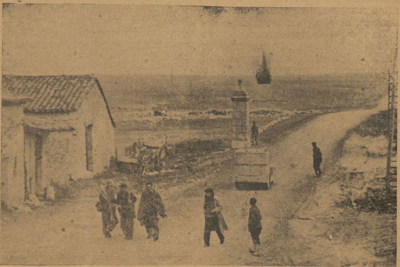
Aquí se está combatiendo. Un disparo de la artillería italiana acaba de hacer explosión

Los republicanos no somos intransigentes en relación a los demás partidos, pero algunos partidos no son transigentes con los republicanos. Y aquí, ciudadanos, hay que meditar. La democracia es transigente; la democracia se mantiene en sus princi-