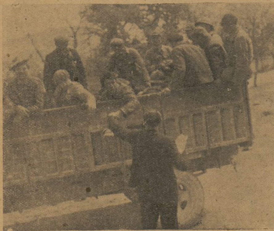
Uno de nuestros redactores regala números de nuestro semanario a las tropas.

tencia para ver quién trabaja más y mejor para la Juventud Española.