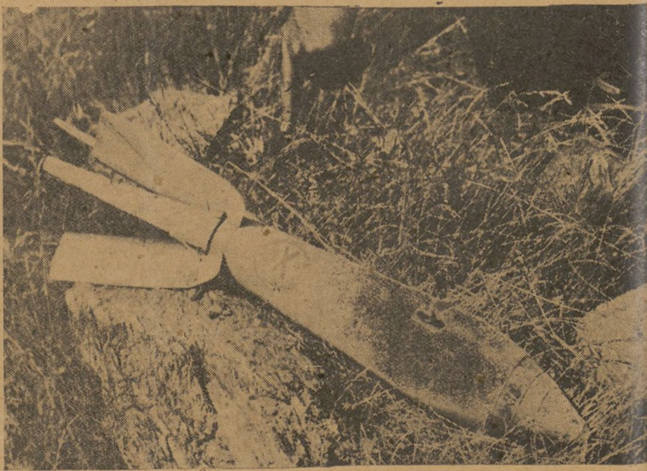
EN LA SIERRA.—Una bomba de aviación "enemiga", que no llegó a estallar. En ella se puede apreciar la corona monárquica.

Nuevamente indicamos que nuestro domicilio social es: Calle de CAMPANEROS, 16, 2.º.—VALENCIA.