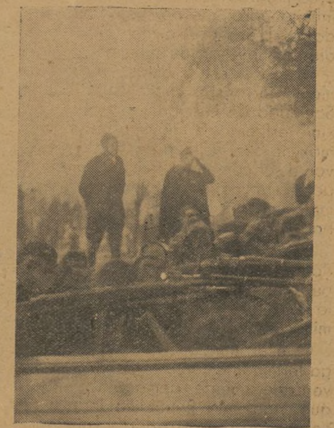
Nuestros valientes luchadores, instruyéndose en el manejo de las armas.

Secretario General del Frente de la Juventud de Valencia