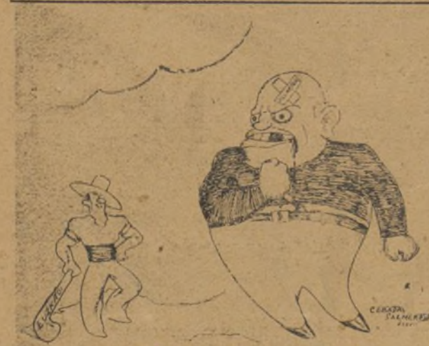
LA SENAL DE LA CRUZ

El interés de la J. de I. R. es reunir- los con estas pequeñas conferencias y la casualidad es que ha sido quien acaba de inaugurarlas con esta in- completa introducción, lo que quiero pedirles, es que guardemos un minu- to de silencio en memoria de nuestros caídos en la lucha.... La Directiva de la Juventud agradece a los asistentes el entusiasmo con que han escuchado a éste, su representante. ¡Viva la Re- pública!