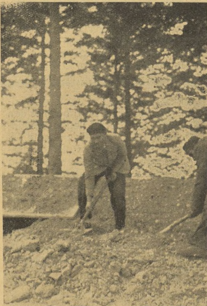
El enemigo está lejos, pero las fortificaciones no se descuidan