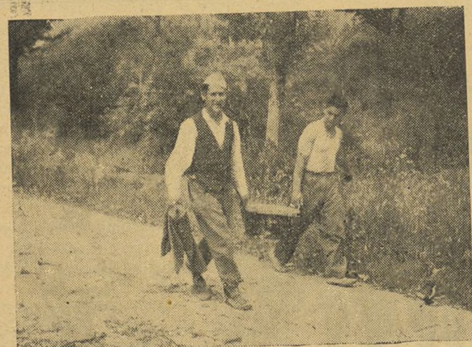
LA HORA DEL RANCHO

La Intendencia se preocupa de los combatientes