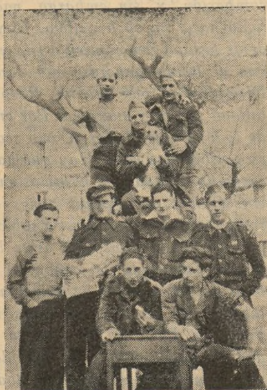
Un grupo de transmisores, formado por jóvenes de todas las ideologías

Defensa Pasiva trabaja activamente en todos los problemas técnicos relacionados con su cometido. Pero no basta que un grupo de técnicos, animados de un admirable espíritu de trabajo y sacrificio, prepare los planos y proyectos que han de servir para la construcción y avituallamiento de refugios, puestos de socorro, etc., indispensables para la protección de la población civil en caso de ataque por bombas de metralla o de gases, si no se dan las facilidades de orden económico precisas para la realización de tales proyectos.