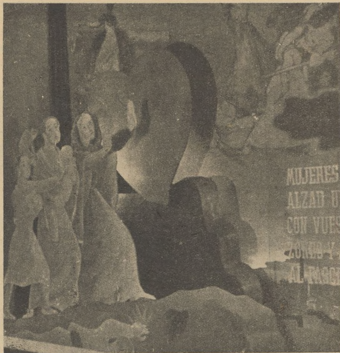
Un detalle de la Exposición dedicada a Madrid

Maquetas y planos de gran interés mostraban cómo se han repartido los bombardeos por el casco de la ciudad; cómo han elegido las granadas enemigas los lugares más habitados y los edificios