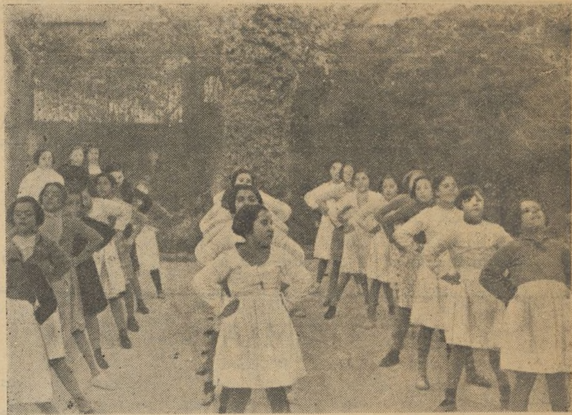
Las niñas de uno de los Colegios de Asistencia social en su diaria clase de gimnasia