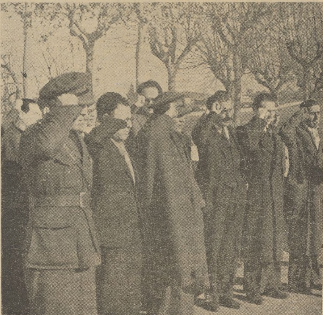
Los periodistas madrileños saludan al paso de los soldados del pueblo

cieron las primeras escuelas de preparación militar. Los jefes u oficiales leales al Gobierno, tuvieron desde entonces una doble misión: hacer la guerra a los facciosos y preparar nuevos jefes, nuevos ofi-