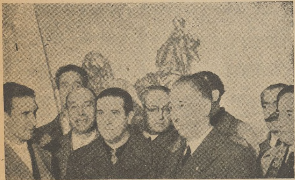
El presidente de la Generalidad de Cataluña, Don Luis Companys con los periodistas de Madrid en el acto de inauguración de la Exposición

Su organización corrió a cargo de la Subsecretaría de Propaganda del Ministerio de Estado y de la Comisaría de Propaganda de la Generalidad. En conseguir el efecto moral deseado han rivalizado