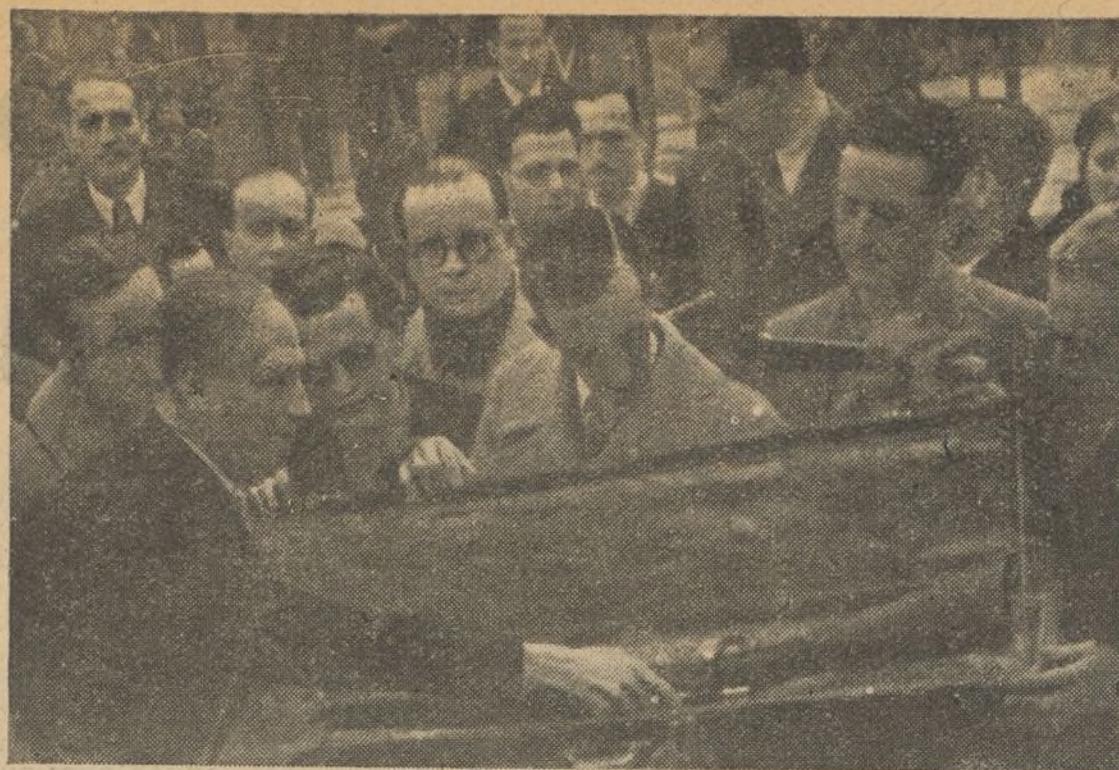
El Presidente de la Generalidad entrega a los periodistas madrileños tres fusiles para el General Mija

España tuvo siempre una industria de guerra, modesta, pero de buenos resultados. Nuestro material nada tuvo que envidiar al que importábamos del extranjero, pero como, por los azares de la guerra, la mayor parte de nuestras fábricas quedaron en campo faccioso ha sido necesario crear en la zona leal todo aquello que ya teníamos funcionando en otras provincias. Hoy nuestra industria de guerra está en camino de ser perfecta y cada día es menor el número de cosas que es necesario importar. Cataluña no es ni mucho menos la región más atrasada; su laborioso espíritu la ha puesto en poco tiempo en condiciones de producir para la guerra elementos ofensivos y defensivos de gran valía. Es de esperar que en breve plazo nos bastaremos para producir todo lo que la guerra exige; es de esperar que produzcamos todo el material que necesitamos para la victoria.