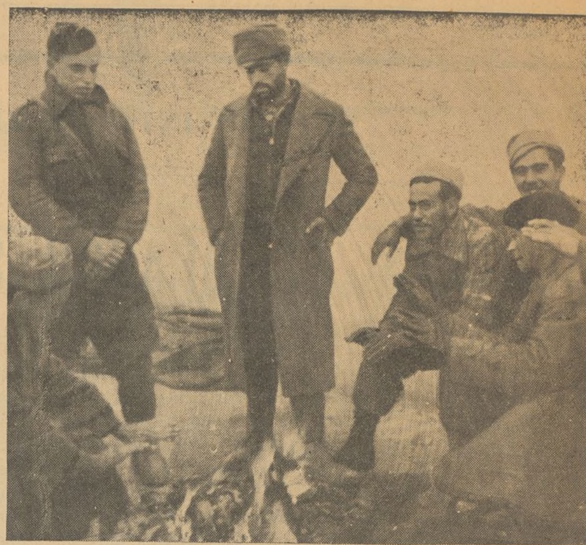
Un grupo de tanquistas del Ejército Republicano descansa junto a la lumbre, en el campo de Teruel

Seguramente la nueva Ejecutiva sabrá responder al movimiento de resurgir republicano que se observa en la referida región, poniéndose a la altura que corresponde a jóvenes de la J. I. R. que unen su capacidad al entusiasmo con que siempre se ha trabajado en esta Organización.