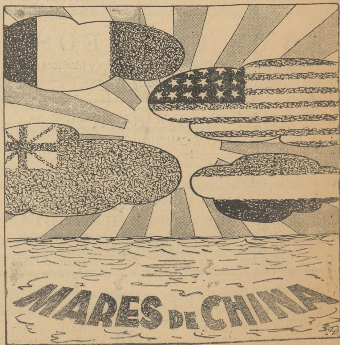
PARTE METEOROLOGICO.—Densas nubes anuncian tempestad.