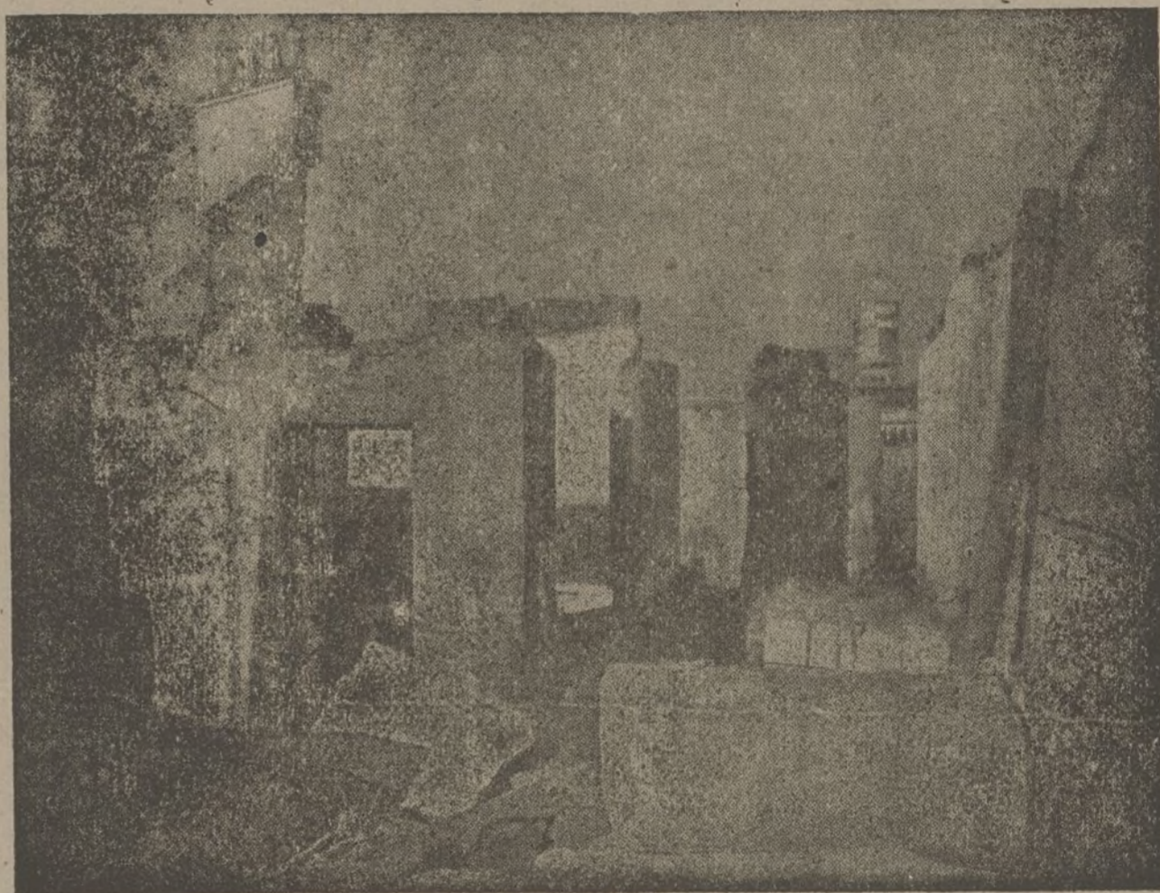
La obra de desolación del fascismo internacional

Por el Consejo Nacional de las J. I. R., LA COMISION EJECUTIVA