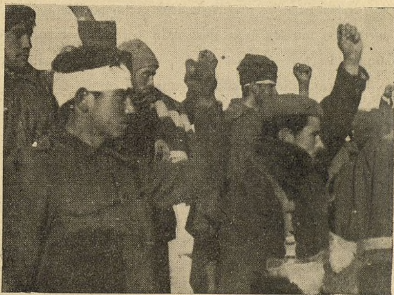
Prisioneros, libres del fascismo

Lentos y en fila llegan por la carretera en grupo los prisioneros. Ya pasó el primer momento de incertidumbre que ha gravitado sobre su porvenir inmediato y sus frentes comienzan a despejarse el entrar en contacto con nuestros soldados. No hará tres horas que aquellos hombres manejaban la ametralladora o el fusil, y es seguro que muchos compañeros nuestros cayeron para no levantarse más, pero los que van prisioneros han perdido ya su peligrosidad y nosotros no tenemos rencor a los que no pueden hacernos daño. Los sanitarios han curado a los heridos y cuando el grupo hace un alto muchos soldados le miran con tristeza, se dan cuenta perfectamente de los momentos por que pasan aquellos hombres y su limpieza de espíritu les impide permanecer impasibles. Algunos se acercan con una sonrisa de incertidumbre a los que esperan en silencio y el eterno tema inicia una corriente de cordialidad entre los hombres que hablan de pueblos en Galicia, en Andalucía o en Castilla. No hay mucho tabaco estos días, pero uno de nuestros motoristas tiene un poco, el oficial que custodia los prisioneros lo ha permitido y él quiere privarse de lo suyo para que lo disfruten unos caídos en los que no solo ven más que unos hombres tristes a los que quiere dar un pequeño alivio muestra de un alma grande.