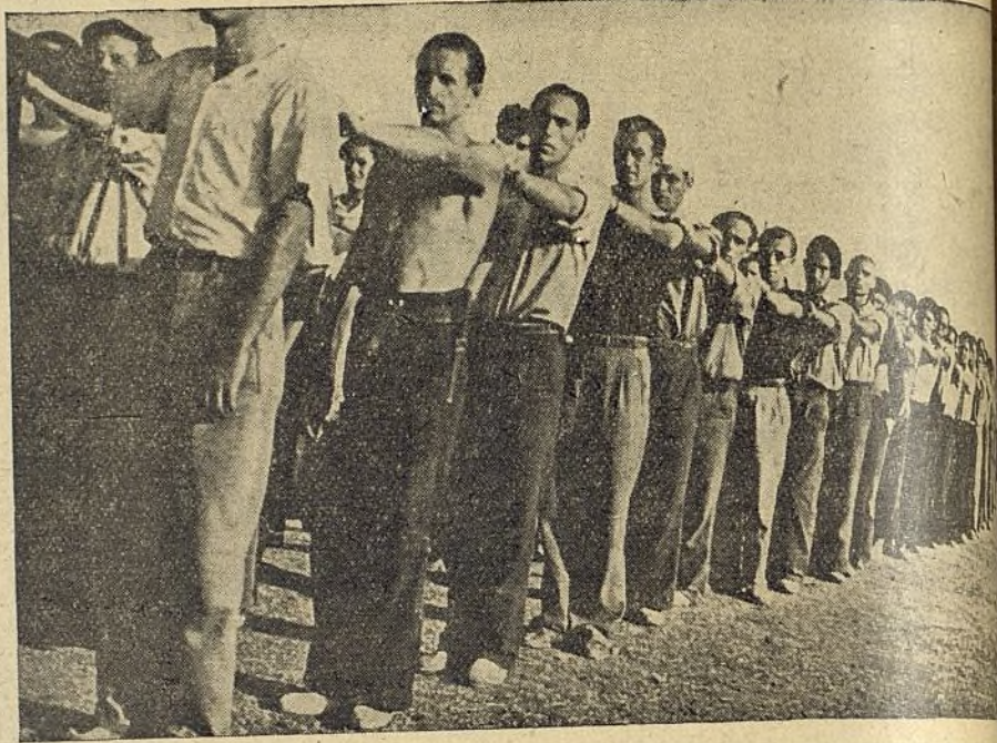
Ayer llegaron a nuestra División, de todos los pueblos de la España libre, los reclutas que van a defender la patria en nuestras filas. Les hicimos fuertes, física y moralmente. Les dimos una técnica militar para combatir con eficacia...

ma a toda la juventud española en la lucha que sostenemos contra el fascismo, junto con la perfecta instrucción militar recibida lo ha hecho posible todo, y así tan extraordinario caso. Porque no sólo los reclutas han sabido dar muestras en el campo de guerra de un valor a