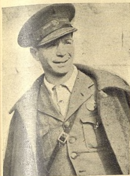
Una Sanidad bien organizada es la mejor garantía para los combatientes

Los servicios sanitarios de nuestra División han funcionado en las últimas operaciones de manera admirable. Ya en los combates anteriores en que han tomado parte los soldados de la 47, nuestra Sanidad había dado pruebas más que suficientes para ser considerada como una de las mejor organizadas del Ejército Popular; pero en estos días pasados se ha superado a sí misma. Jamás han podido ser atendidos los heridos de guerra con más prontitud ni cuidados con mayor celo y maestría.