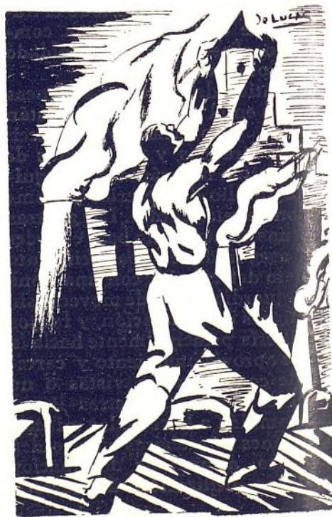
El Gobierno debe de incautarse de todas las industrias que no trabajen para resolver las necesidades de la guerra

Son dos condiciones, la lucha revisa a los hombres y obliga a llevar a su conciencia y responsabilidad de jefes, las formaciones generales y precisas para llevar el uniforme glorioso de las masas armadas del pueblo español en su condición de oficial o clase de nuestro Ejército.