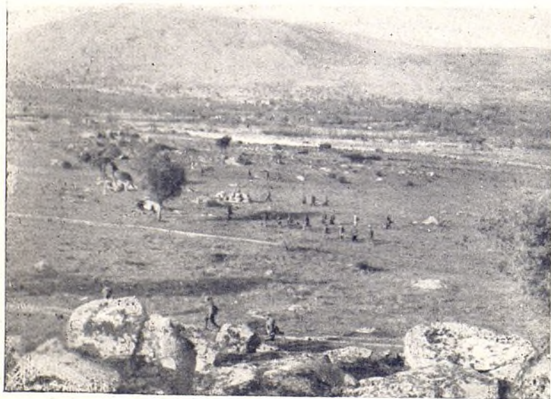
Las fuerzas despliegan para cubrir los objetivos

Al cabo de tanto tiempo nuestra Unidad ha tenido ocasión de probar (aunque no como nuestros combatientes hubiesen querido) que puede ser unas de las bases para una gran unidad. Nuestra prueba ha sido presenciada por camaradas competentes que han reconocido públicamente nuestros progresos, aunque también pequeñísimos errores.