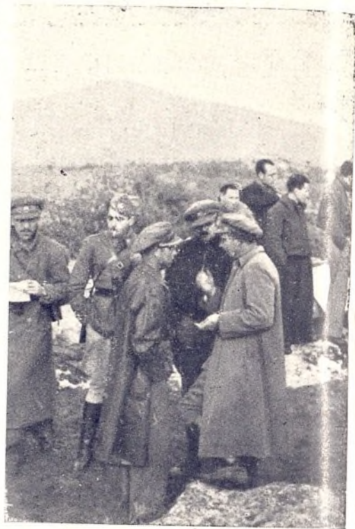
Mandos y Oficiales de nuestra Unidad comentando la marcha del supuesto táctico

nuestra consigna. Hoy tenemos medios. Este tiempo tiene que ser aprovechado por todos nuestros combatientes por que pocas ocasiones puede que se nos presenten. La frase el «tiempo es oro» hay que tenerla presente para demostrar que nuestros hombres tienen en cuenta el factor tiempo para, aprovechándolo, convertir a la Brigada en una gran unidad, que con el ejemplo sea uno de los sostenes más firmes del Ejército Popular.