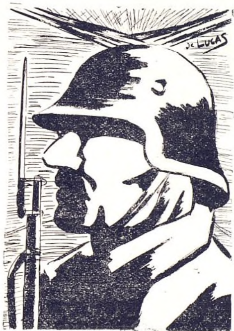
Nuestro soldado, consciente de su deber, espera firme en su puesto de combate

terraplenes, alturas, zonas fáciles de de batir, preparación de fuegos dominando zonas de comunicación y combate, etc. señalará cada soldado una sola dirección de su fuego y circunstancias en que debe variarlo, señalarle posibilidades de contención del ataque enemigo, desniveles que puede aprovechar el enemigo como abrigo contra el fuego de nuestras armas; no dejar a un sólo soldado sin haber estudiado ni una sola de las características que pueden ser aprovechadas por los fascistas para en el terreno individual atacarle. Al hacer este trabajo y esta preocupación conseguiremos el desarrollo de la idea técnica colectiva