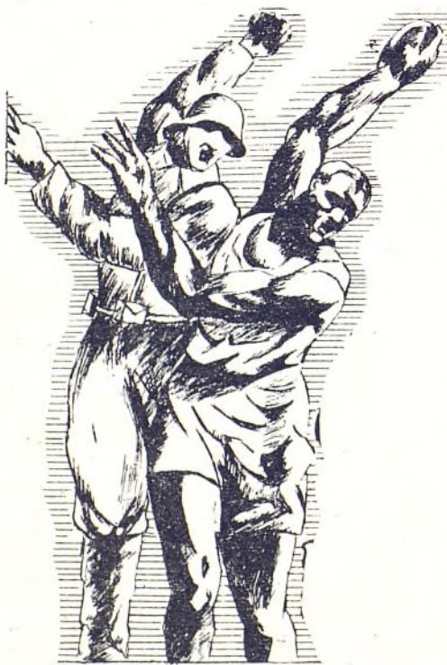
Intensifiquemos el deporte que tenga una aplicación militar (saltos, lanzamientos de disco, peso y jabalina)

«Moral y táctica, base de mis mandos»; es una frase de un General francés que puede ser la base de corrección de errores y estudio por nuestros mandos para formar la orientación precisa de lo que significa dirigir una unidad por pequeña que esta sea. Todo oficial o mando debe basar sus conocimientos en estas dos frases: ¡Moral! ¡Táctica! Un