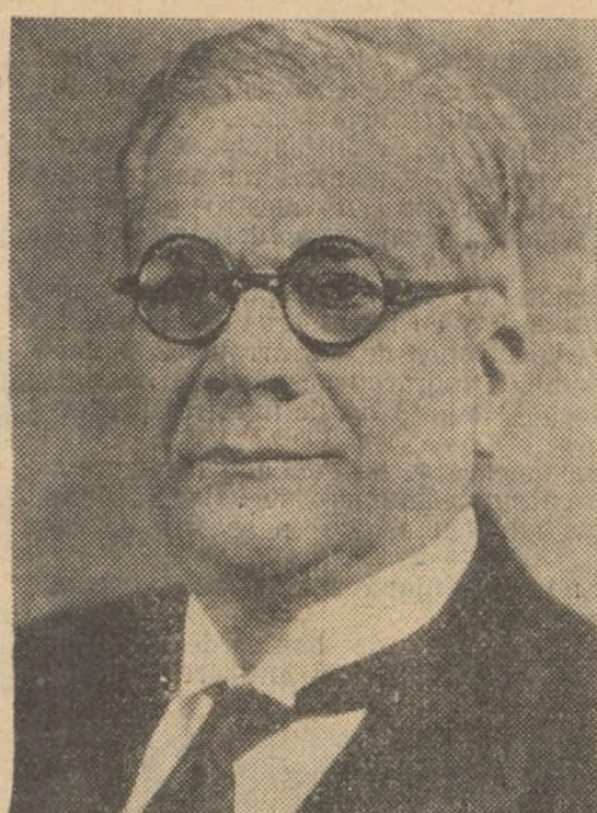
GERARDO MACHADO L'ancien bourreau de Cuba.

Le Mexique mis à part — où la révolution sociale et raciale de 1910, malgré bien des vicissitudes, des retours en arrière ou des tentatives de stoppage, réalise lentement son programme et semble avoir mené à bien sa tâche essentielle, celle de la réforme agraire et de la libération du « péon » — les anciennes possessions espagnoles ou lusitaniennes sont en effet au pouvoir de la tourbe militaire, plaie de l'Amérique « latine » ou entre les mains des représentants du féodalisme capitaliste, qui se sont érigés en sauveurs de la patrie et de la civilisation menacées par le « communisme ». Le communisme englobant naturellement tous les défenseurs de la liberté, les partisans de la légalité constitutionnelle et les travailleurs luttant pour la défense de leur pain.