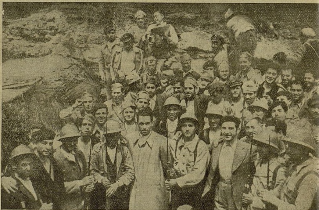
Camaradas de la Sección del Matadero con un grupo de soldados del 3er Batallón.

Este deseo se ha realizado. Y han sido nuestros camaradas, los obreros de la Sección del Matadero (U. G. T.) de Madrid, de tan buen historial revolucionario y del cual es miembro destacado nuestro querido Comandante Carro, los que se