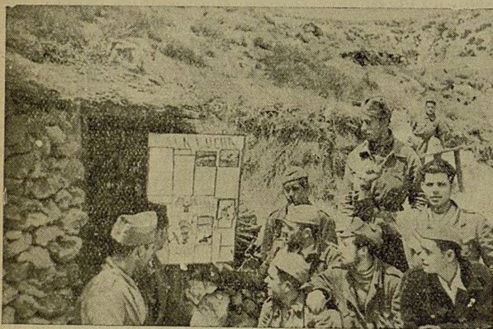
Al salir de la Escuela los zapadores leen y comentan su periódico mural.

El campamento de Zapadores de nuestra Brigada, unas cuevas, unos hombres que a distancia se confunden con el color de la tierra salpicada de pequeños matorrales, hombres que vinieron voluntarios desde tierras lejanas, tierras impregnadas de paz, de tranquilidad; hombres que dejaron su familia y su hogar para venir al frente a combatir, a luchar contra el opresor. Estos hombre, hombres incultos; faltos de co-