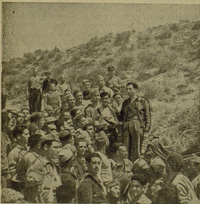
Nuestro infatigable Comisario dirige la palabra a los heróicos soldados de nuestra Brigada, en uno de los frentes del Jarama.

Como animador se le conoce, en el combate, en las trincheras, en el tajo, en la plaza donde con sus charlas deleita y reafirma las convicciones antifascistas de los campesinos. Todos le estimamos, todos le queremos. Y él en justa reciprocidad se desvive por nosotros, procurando que en lo posible nada falte a su querida Brigada. Sirvan estas líneas como expresión de cariño y reconocimiento hacia él de todos los componentes de la 18ª Brigada.