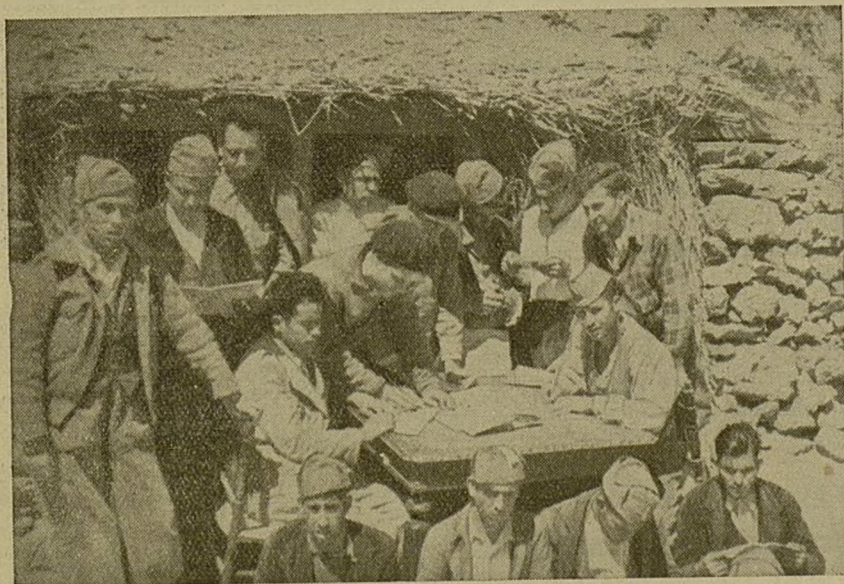
Como esta escuela hay en todas las Compañías. En ellas se combate el analfabetismo y se crea un ejército capacitado.

Si repasamos despacio sus pasos veremos con aun dentro de la República, no ocultaban sus esperanzas de poder traer alguna vez a España a su caudillo «el infante don Carlos como sucesor legítimo» de la Corona de España, y como es natural, el que por «derecho propio» le correspondía regir los destinos de nuestro país. ¿Qué se podía esperar de semejantes alimañas? Antes, sus principios ideológicos de monarquizantes absolutistas; y ahora, desaparecido el punto fundamental de su lucha (caudillo don Carlos), nos demuestran las bajas pasiones que siempre han tenido y lo falso de su posición anterior que no era más que encubrir sus deseos de explotación e injusticias pues, desaparecido el «caudillo sin sucesor ¿qué defiende? Esta es una de las fases del fascismo español, y contra éstos luchamos, camaradas. Sus disfraces ridículos nos demuestran su cobardía y, nosotros, impregnados del odio que esta gente nos inspira sabremos vencerles: primero por una convicción ideológica ya que ellos son el mayor obstáculo y después por su cobardía. MARÍN