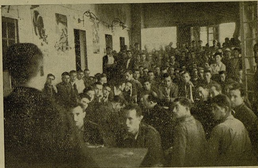
Una conferencia en nuestro Hogar del Combatiente.