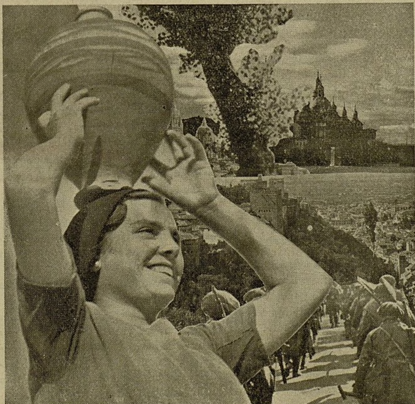
Mientras los soldados marchan presurosos a cubrir su puesto, esta campesina mira sonriente el magnífico porvenir de España.

Por todo esto, los soldados del pueblo deben aprender la técnica militar, emplazamiento de toda clase de armamento y dispuestos para cuando se ordene el ataque final que libere al mundo.