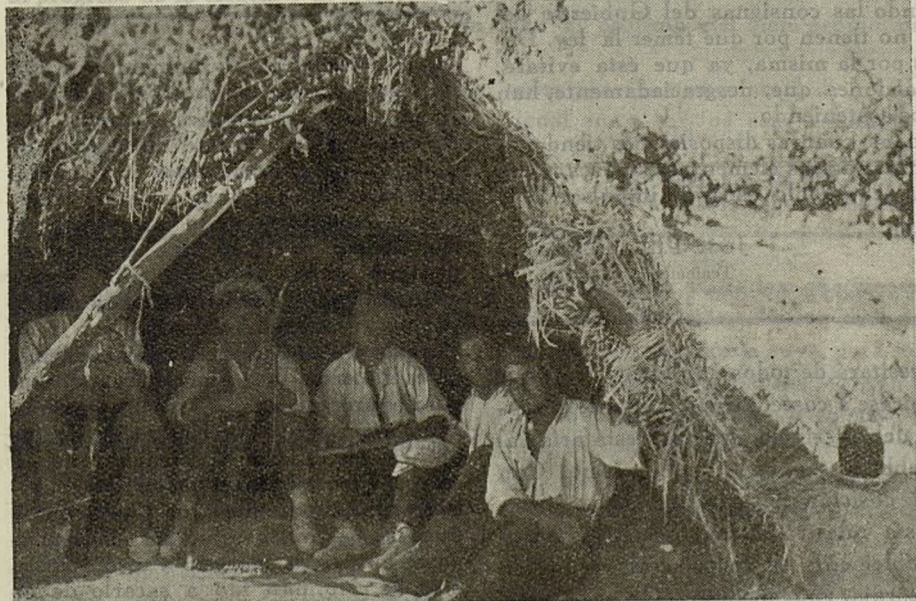
Soldados de nuestra Brigada descansando en una rústica chavola, después de duras jornadas

¡Estemos siempre dispuestos a iniciar el principio del fin del fascismo invasor!