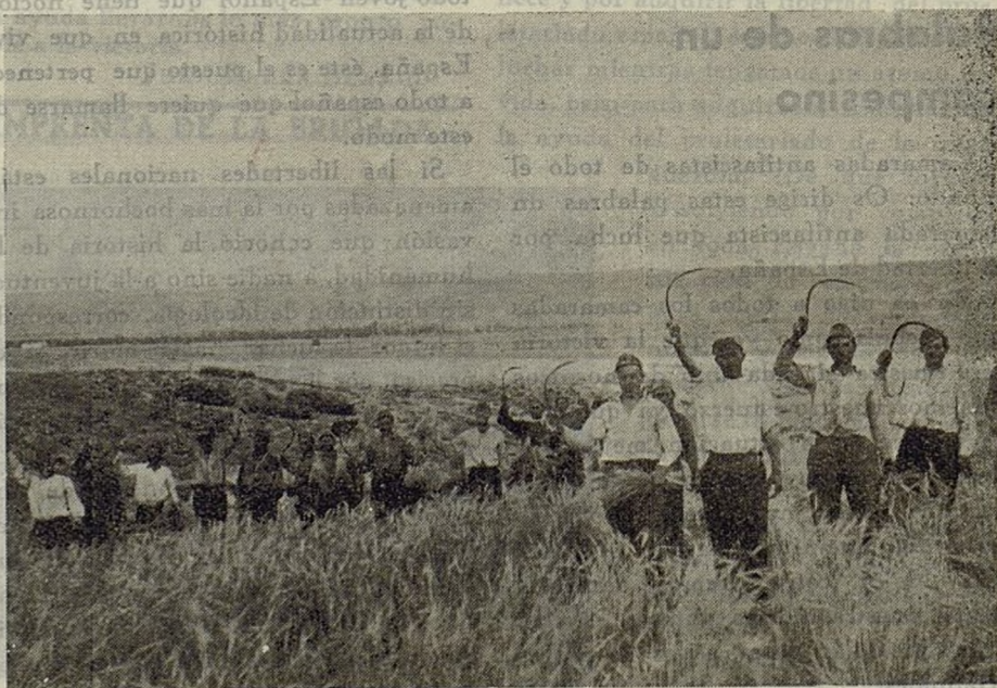
Soldados de la 18. a saludando a sus compañeros de armas en un alto en el trabajo de la siega.