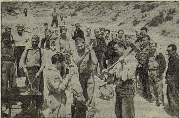
Una herrería de campaña Ayuntamiento de Madrid