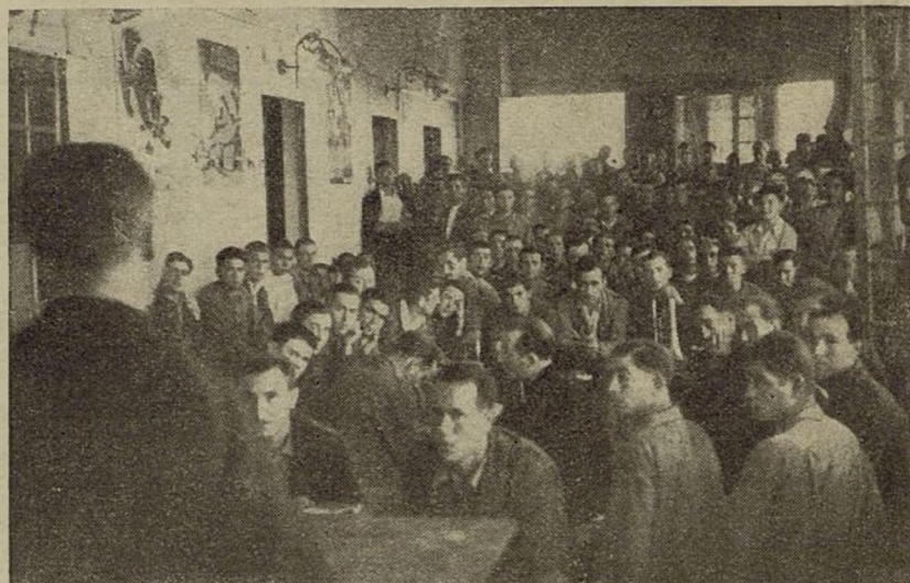
Una de las clases de Cultura en la Brigada

El pesimista y el derrotista, son nuestros más disimulados y peligrosos enemigos. ¡Acabemos de una vez para siempre con esta clase de parásitos!