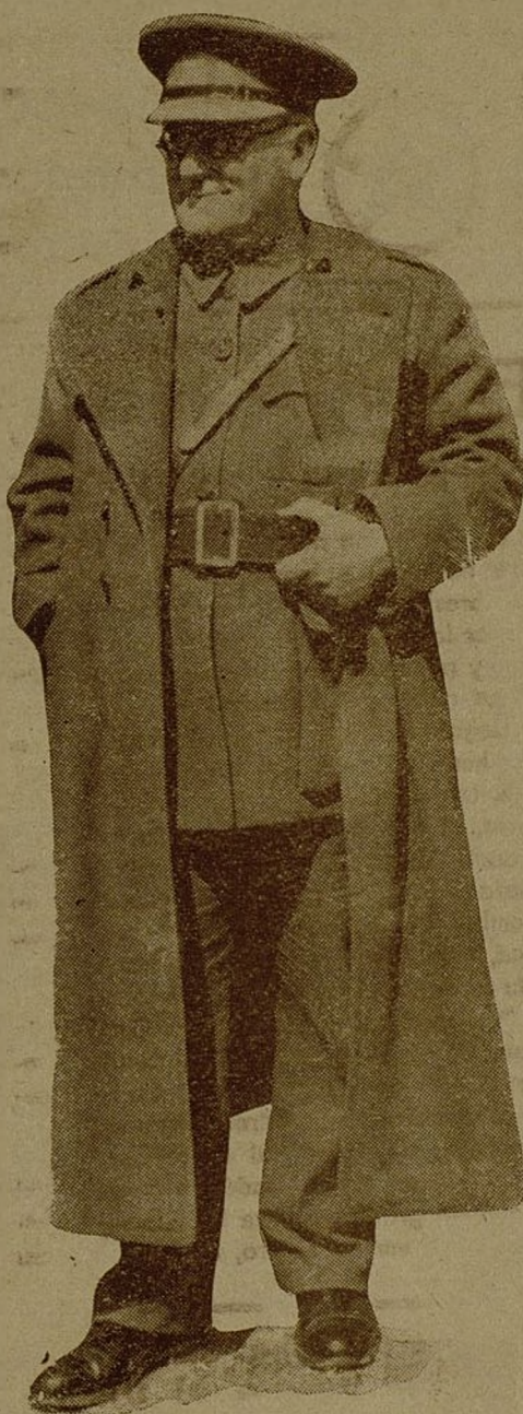
Don José Miaja, gloriosa encarnación del pueblo de MADRID en su heroica defensa del 7 DE NOVIEMBRE

había de dar un mentís a aquella célebre "quinta columna", que a los cuatro vientos pregonaba, como el traidor