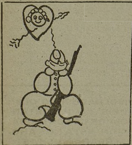
Quando estés de centinela no pienses en tu Micaela.

PROCURA QUE ESTOS CONSEJOS NUNCA SE TE HAGAN VIEJOS Por J. MAS