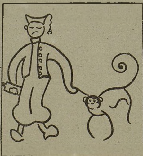
De licores ni una toma no cojas alguna mona.