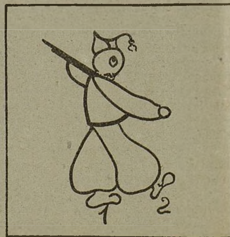
Demuestra tu porte altanero marcando el paso ligero.