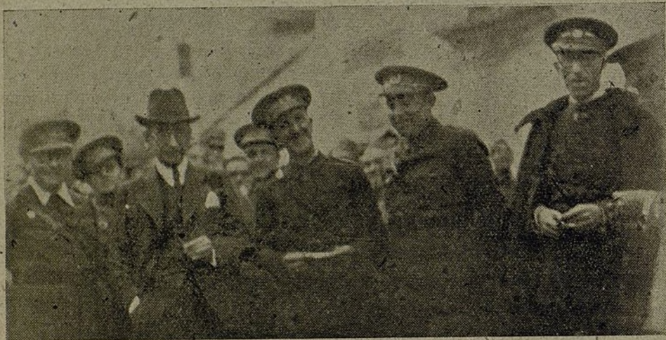
EL JEFE DEL EJERCITO DE LEVANTE, EL PRESIDENTE DEL TRIBUNAL DE GARANTIAS CONSTITUCIONALES, EL JEFE DEL XIX CUERPO DE EJERCITO Y EL JEFE DE E. M., EN UNA DE LAS ULTIMAS VISITAS A NUESTRO FRENTE

Así vamos, hacia nuestra España, serenamente seguros, con la interior satisfacción de sabernos tratados por aquellos a quienes su enorme responsabilidad podía excusarles de ser cordiales, con el espíritu comprensivo