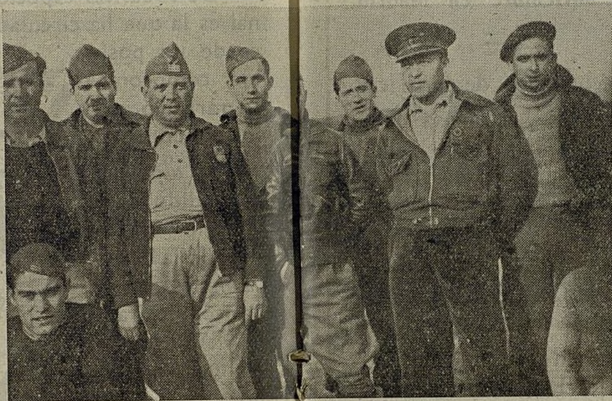
Jefe, Comisarios y oficiales del Batallón

Loma Gorda los guarda en su seno. Allí mismo, en rústica sepultura, están reclamando venganza. Los soldados, de cuando en cuando, cubren su tumba de flores. Sencillo homenaje lleno de sublime grandeza. Saben también que los cuerpos de sus malogrados camaradas, les obliga más aún a defender aquella posición testigo mudo de su heroísmo. Ellos lo saben. Es como un compromiso tácito. Y están dispuestos a cumplirlo. Loma Gorda tiene un atractivo especial para