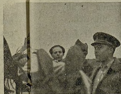
Junto a heridos, el Comisario preocupado por la suerte de sus hombres

Aun en la actual etapa de nuestros soldados. Tiene personalidad propia. Monte querido, se ha incorporado a la historia de la Brigada. Cuando lo escalan nuestras bajas. Unas producen miradas de asombro por el plomo enemigo hondo sentir, a la sencilla tumba que encierra los cuerpos de nuestros héroes.