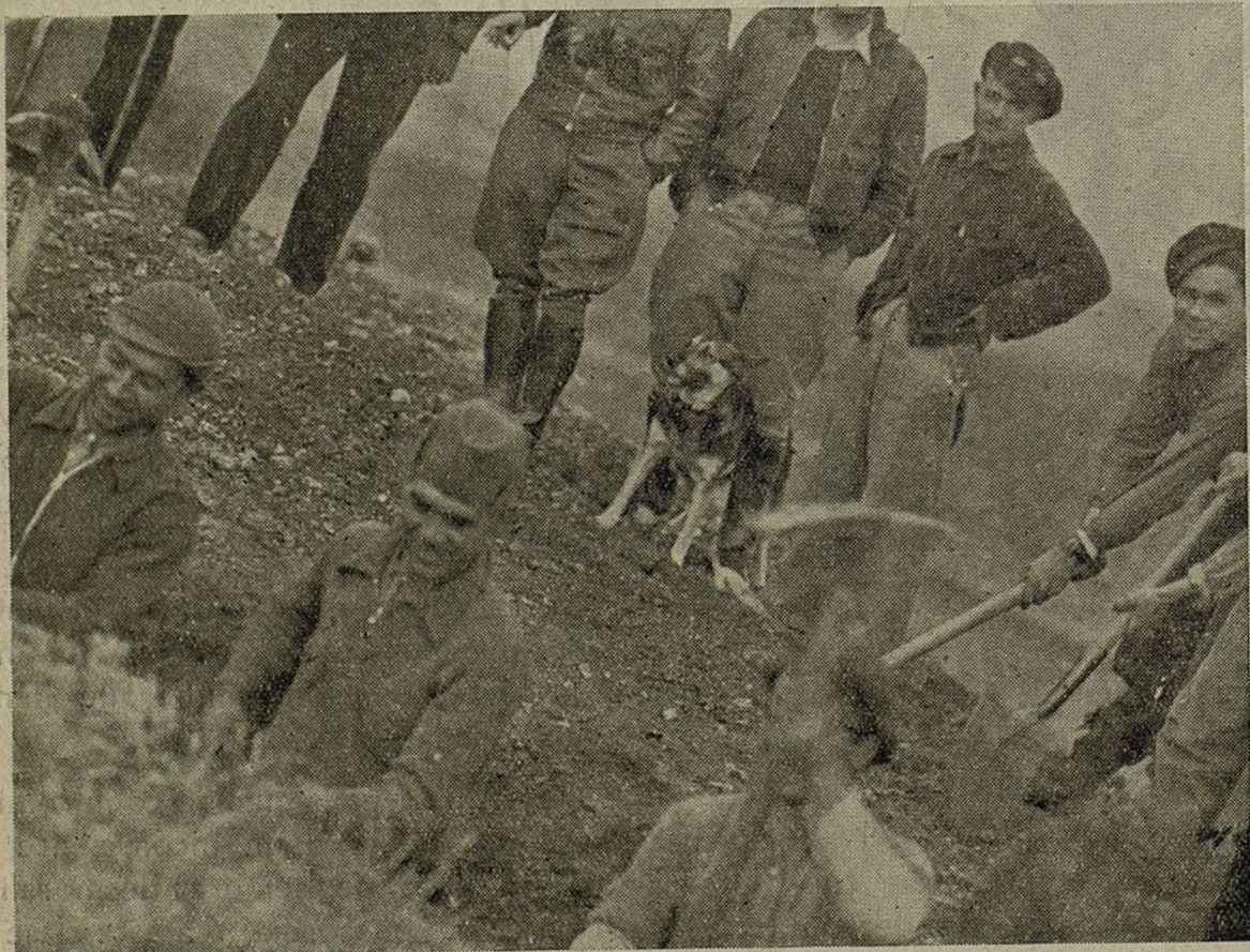
Los soldados trabajan alegres porque así hacen infranqueables las posiciones

Con las caras radiantes de juventud y de vida trabajan estos muchachos que saben no pueden regatear ningún esfuerzo cuando se trata de la defensa de tan vitales intereses.