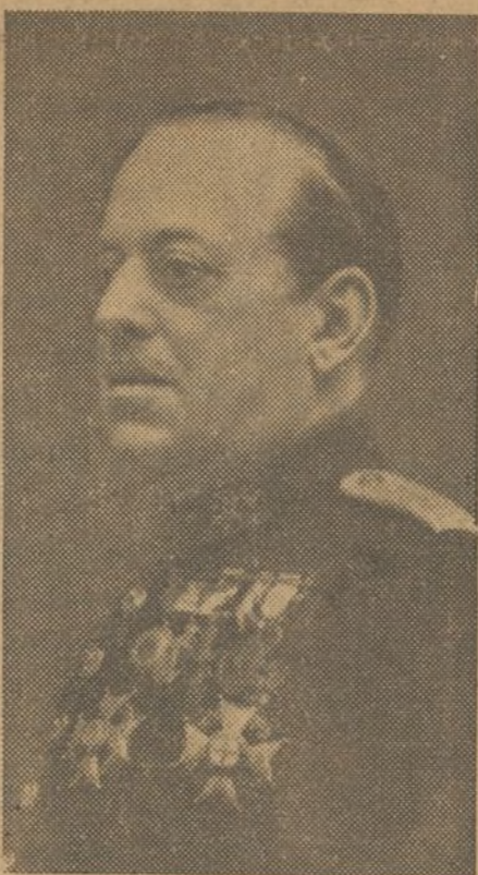
El Glorioso General Sanjurjo ¡Presente!