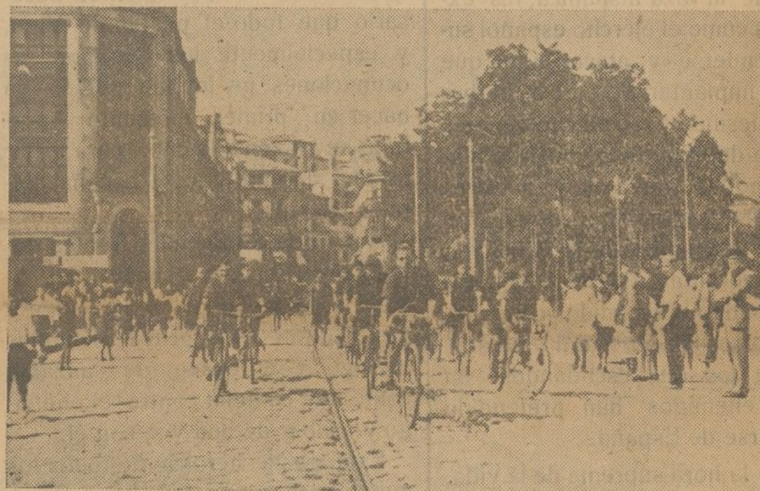
Vigo.—Desfile de los «flechas» en la Plaza de Compostela