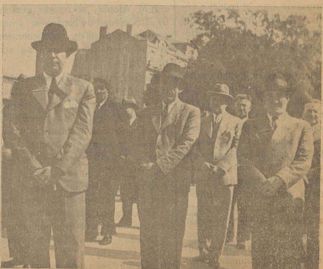
Conocidos elementos vigueses alistados en la Guardia Cívica