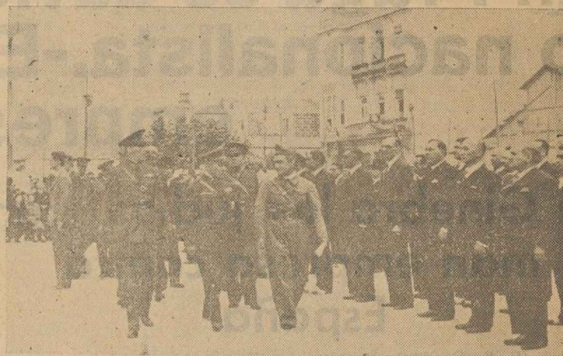
Las autoridades pasando revista a la Guardia Cívica viguesa

Paris 25.—El enviado especial de «Matin» en Ginebra comunicó que «Hoy tal vez sea un día teatral. Anoche hubo una reunión de representantes sudamericanos y se dice que seis de ellos dieron a entender que sus gobiernos están dispuestos a reconocer la Junta de Burgos, pero que este caso actualmente tratado en las capitales de América del Sur, no sería presentado en Ginebra».