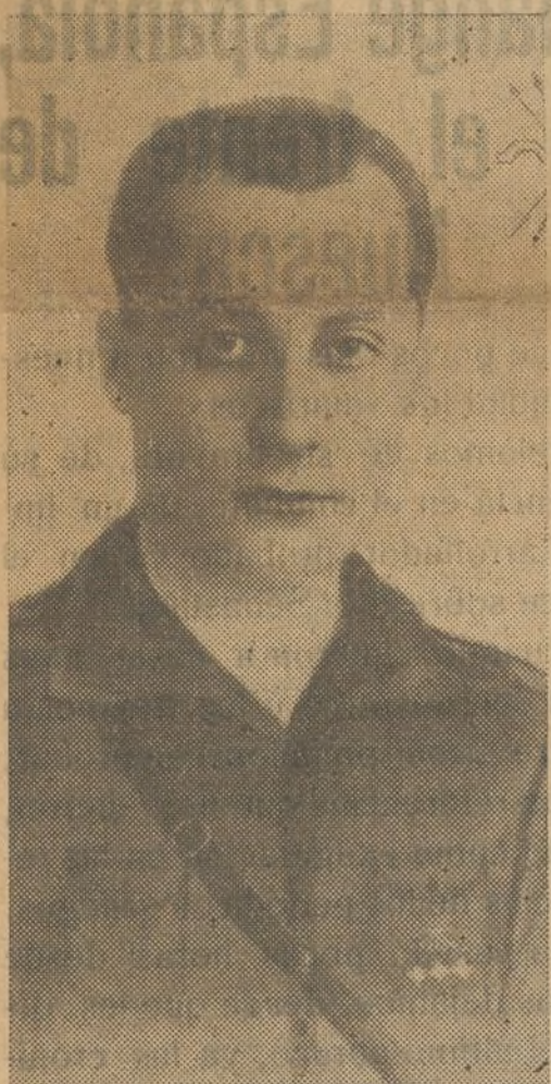
José Antonio Primo de Rivera

El padre honró a España. El hijo la reconstruye.