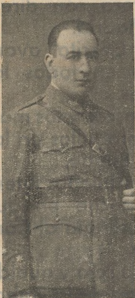
El heroico Capitán Carrero ¡Presente!