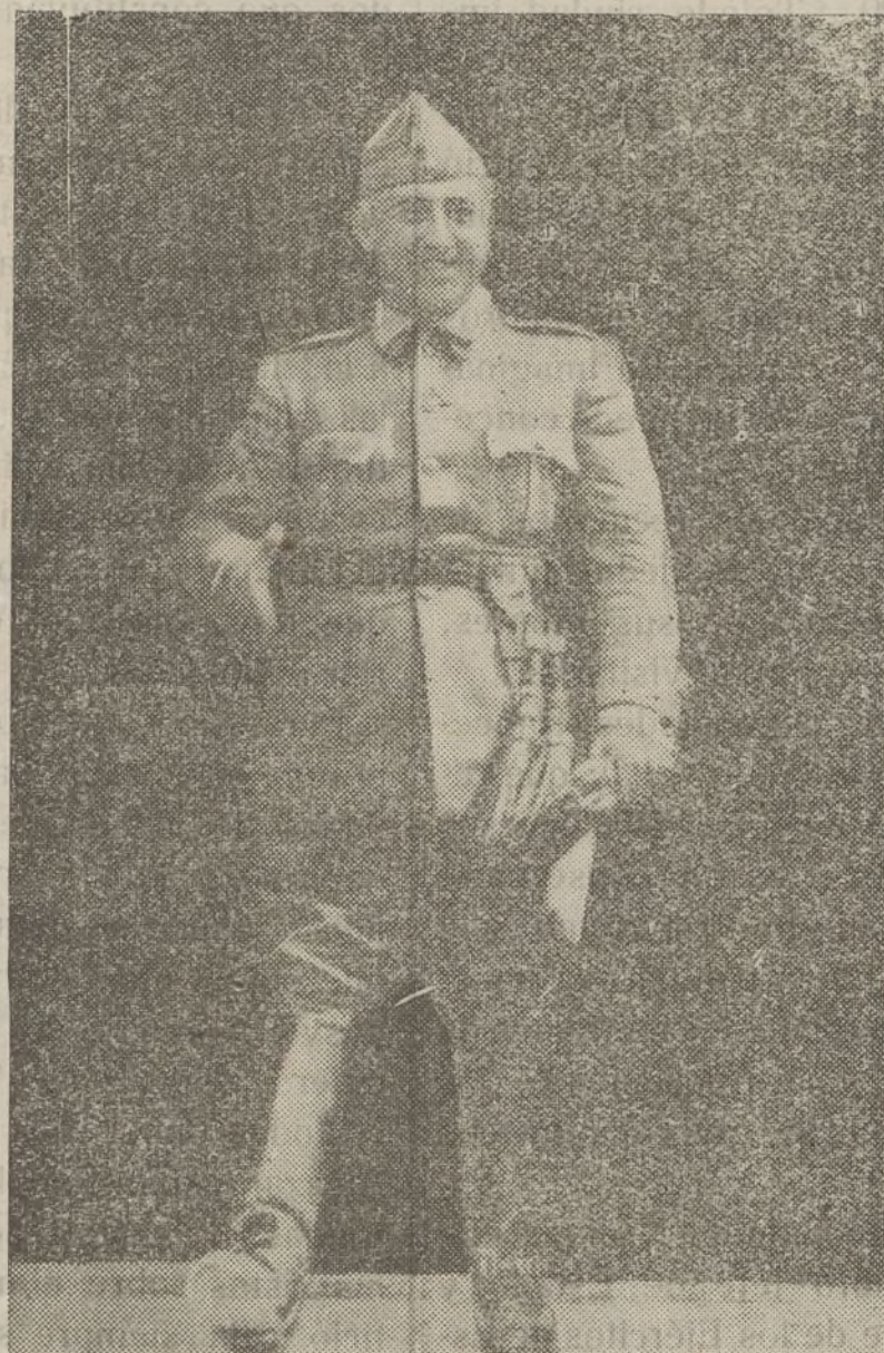
General Franco Jefe del Gobierno del Estado Español

Eibar, centro industrial importante tiene la impresión que toda resistencia será inútil y que no tardará en ser tomado por las tropas nacionalistas. También se sabe que un submarino que servía de enlace entre Bilbao y algunos puertos extranjeros y que hasta hace algunos días era utilizado para determinadas transmisiones, fué abandonado por su tripulación.