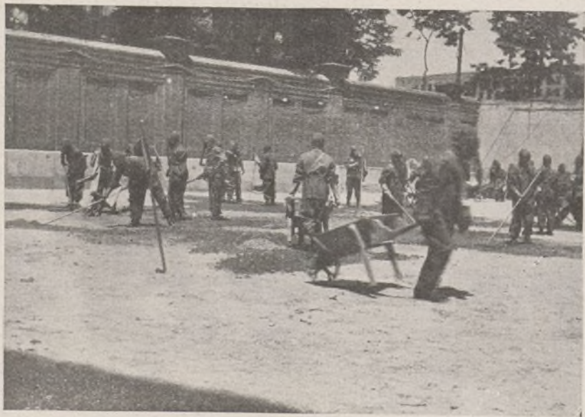
La primera Compañía durante las prácticas hechas ante el General Miaja.