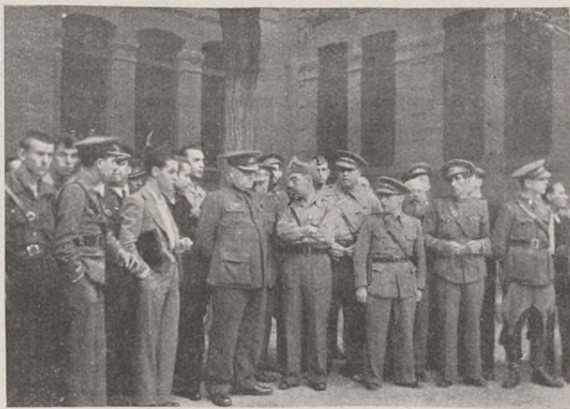
El General Miaja presenciando las prácticas realizadas por la primera y sexta compañías.

Nuestro saludo a los camaradas que a pesar de hallarse lejos, se encuentran espiritualmente a nuestro lado.