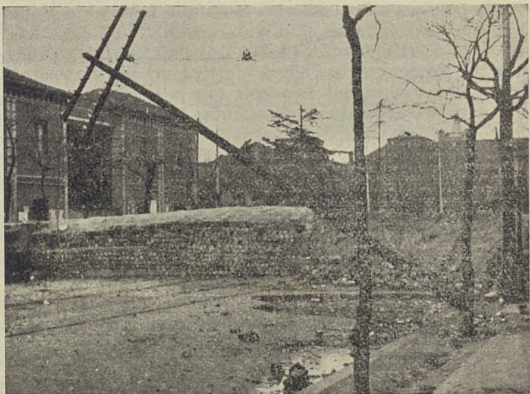
Los postes que las bombas de la "No Intervención" derriba...