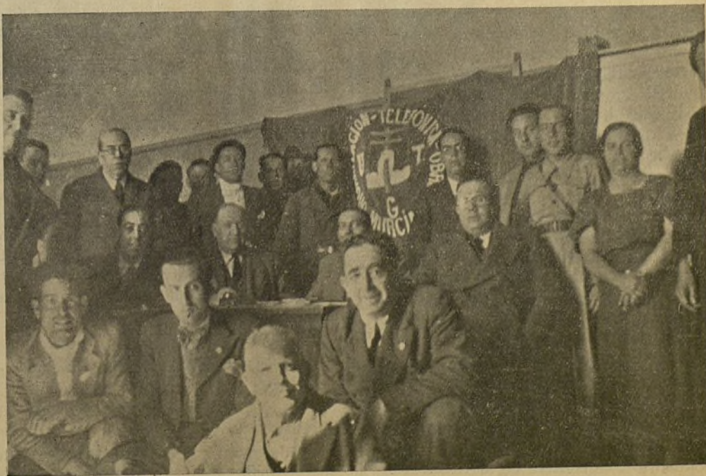
En Murcia, como en todas las Secciones, se ha celebrado una Asamblea preparatoria del Pleno del C. N.; en la fotografía se recoge un aspecto de la misma.

Proyecto de Normas de Organización. —En el ánimo de la Ponencia ha influido el deseo de dar a nuestra Organización una mayor agilidad en su desenvolvimiento sindical; esto forzosamente había que acometerlo, evitando al mismo tiempo tratar de aquellas cuestiones reglamentarias que afectasen al articulado de los Estatutos, tratando de modificar en cualquier aspecto, la línea que desde el Congreso del año 1933 existe. La dificultad de reunir una cantidad de representaciones como acuden a un Congreso, y el hecho de estar una parte considerable de nuestros afiliados en la España franquista, nos ha impelido al mismo tiempo que rechazábamos esta idea, que considerábamos irrealizable, dotar a nuestra Organización de un sistema adecuado, que sin representar una reforma de los Estatutos, sí cubriese las lagunas que en el desenvolvimiento sindical se observan. Es por ello por lo que la Ponencia aconseja al Pleno tome en consideración el proyecto de Normas de Organización elaborado por el C. E.