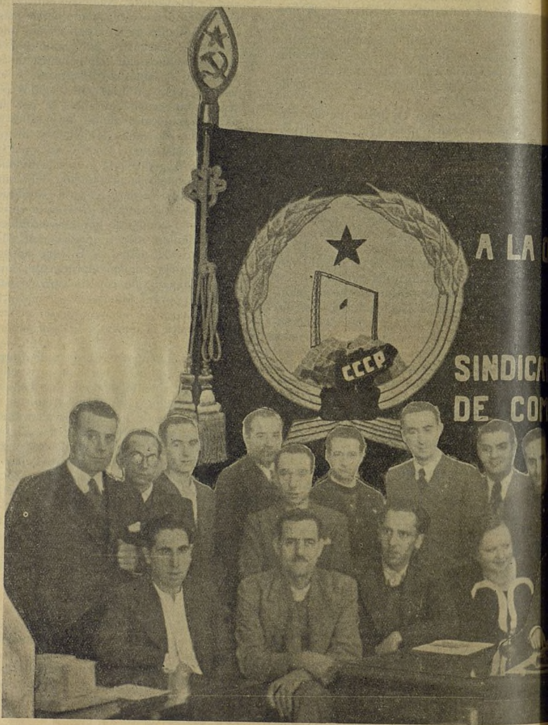
ASISTENTES AL PLEN

Secretariado de Legislación y Normas Sociales.