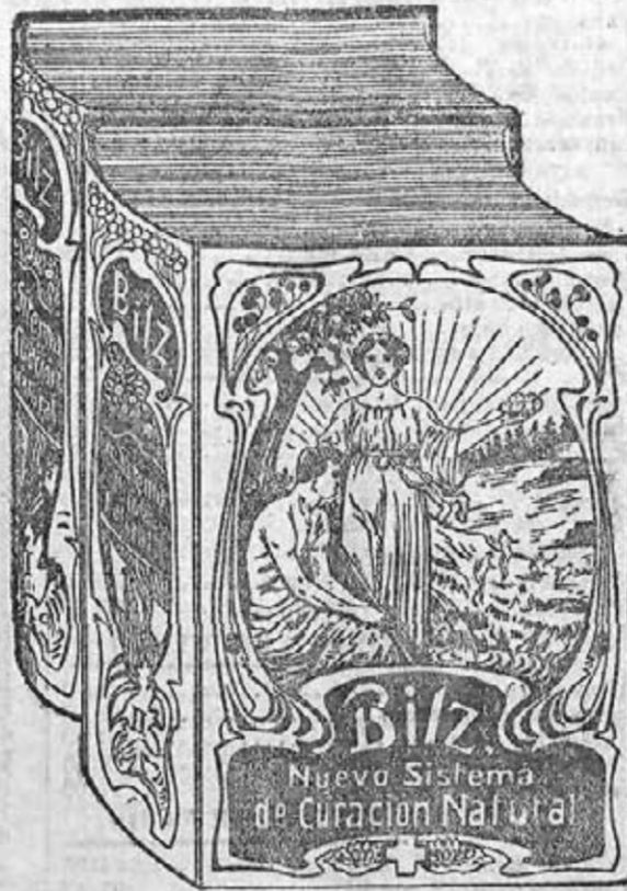
Ejemplar de la encuadernación.