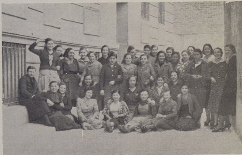
Estas alegres muchachas son las incansables stajanovistas de Valle.

El trabajo de estos héroes, de los «stajanovistas» de Madrid, es preciso que no pase desapercibido para nadie; merecen nuestro más sincero homenaje por el brío que ponen en su trabajo y el sacrificio con que lo realizan.