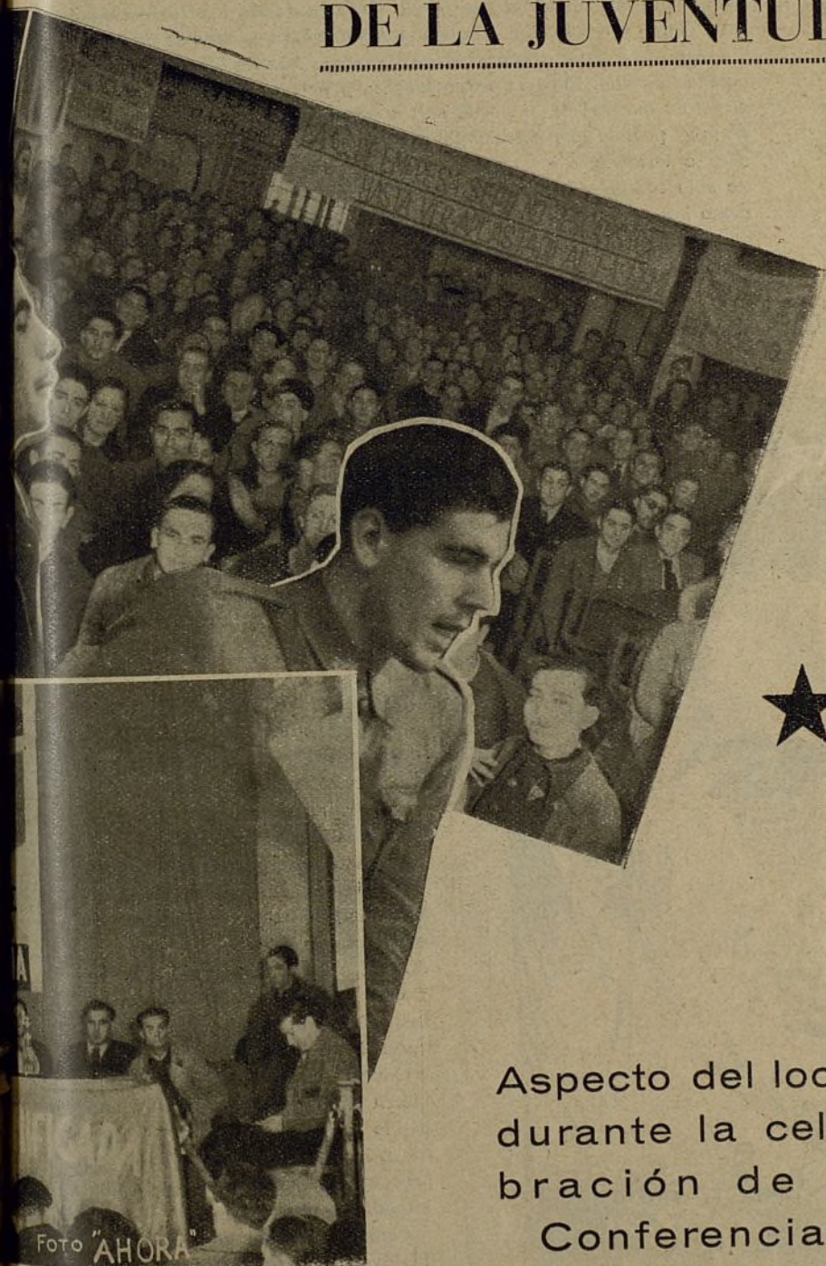
Aspecto del local durante la celebración de la Conferencia.