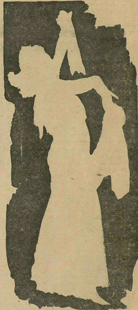
NOMBRES DE LOS SOLUCIONISTAS Y NÚMEROS DE SU SOLUCIÓN