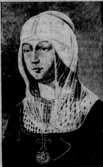
ISABEL LA CATOLICA EN SUS ULTIMOS AÑOS

Ansioso, siempre abrasado en la fe de su ideal, interrogando a las estrellas y al mar, y trasladando, con la regla y los compases, una y otra vez, sus observaciones a los planos, se afirmaba cada vez más para poder descubrir la nueva ruta que tanto le preocupaba; y cuando perdida toda la esperanza en la ayuda que le habían ofrecido los hombres, y cuando quizá se arrepentía él de haber nacido hombre, por no llegar a ser comprendido por los de su