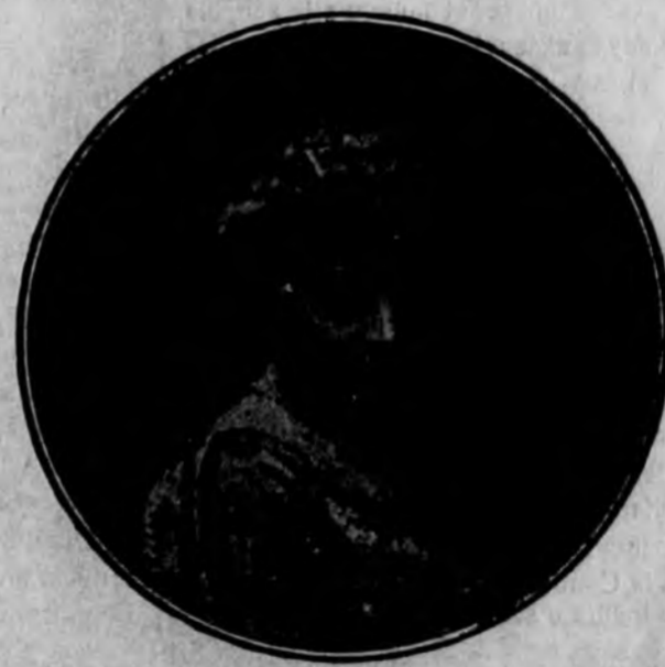
CONDESA DE SAN RAFAEL, ILUSTRE SOCIOLOGA, FUNDADORA DEL BAZAR DEL OBRERO, HOY ESCUELA MUNICIPAL DE ARTES Y OFICIOS

que todos calificaron de temeraria y que sólo una mujer, la gran mujer castellana, que se llamó Isabel I, supo comprender y apoyar reglamente, como sabía hacerlo ella.