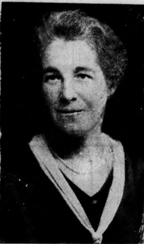
MRS. CORBETT ASHBY PRESIDENTA DE LA ALIANZA INTERNACIONAL PARA EL SUFRAGIO DE LAS MUJERES

mente y a navaja a la desdichada caprichosa, quien, una vez desposeída de sus cabellos, ni más ni menos que un delincuente chino, fué arrojada del hogar conyugal, con la conminación de no volver a él hasta que no tornara a lucir sus hermosas trenzas, sacrificadas a un capricho necio y a una desobediencia culpable.