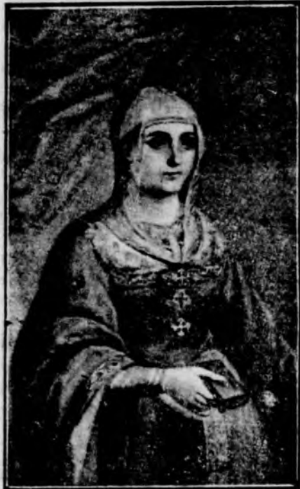
ISABEL LA CATOLICA EN SUS PRIMEROS AÑOS DE REINA

París.—La colonia norteamericana está de luto con la muerte de madame Edward Tuck, generosa bienhechora, a la que París debe el hospital Stelli, que funciona desde hace veinticinco años; una Escuela del Hogar, donde