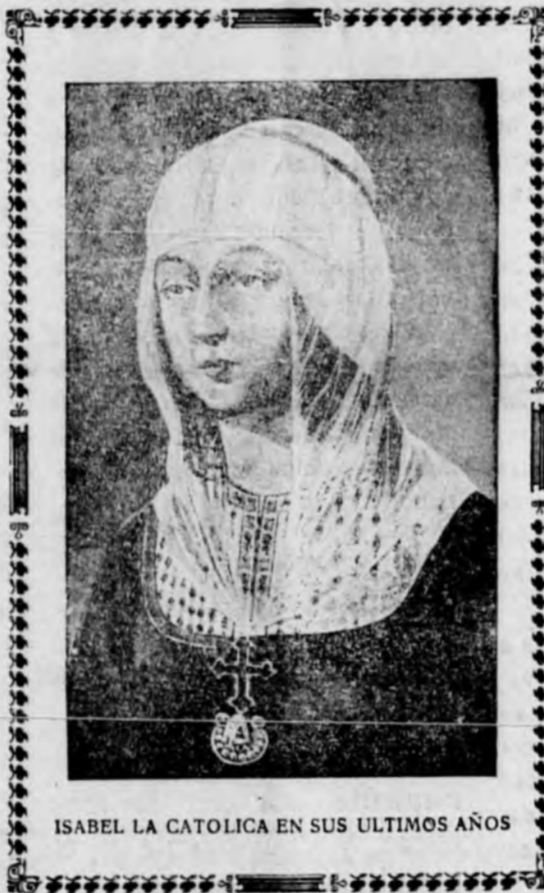
ISABEL LA CATOLICA EN SUS ULTIMOS AÑOS

El día 26 de este mes cumple el 424 aniversario del fallecimiento de esta Reina, ocurrido en su palacio de la plaza Mayor de Medina del Campo, el 26 de noviembre de 1504.