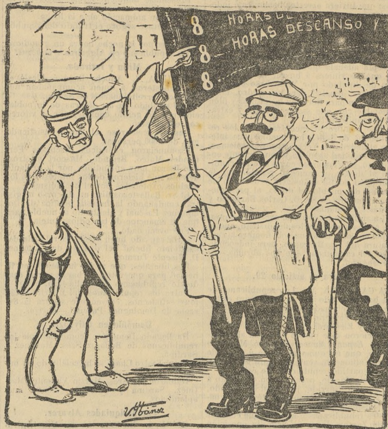
El obrero.—Compañero, ¿y las otras ocho horas? El portapendón.—Esas son las que me ocupan la Nunciatura y Palacio.