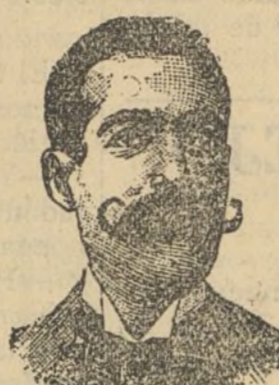
COSTANZI Busto y nombre registrados.

10, ESPOZ Y MINA, 10 Siempre tiendas de Lujo