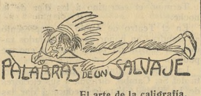
El arte de la caligrafía.

Los periódicos radicales juzgan con sim- patía el reformismo obrero, que tiene un gran nombre en Bernstein, y en Fran- co, en Brand, Viviani y Millerand.