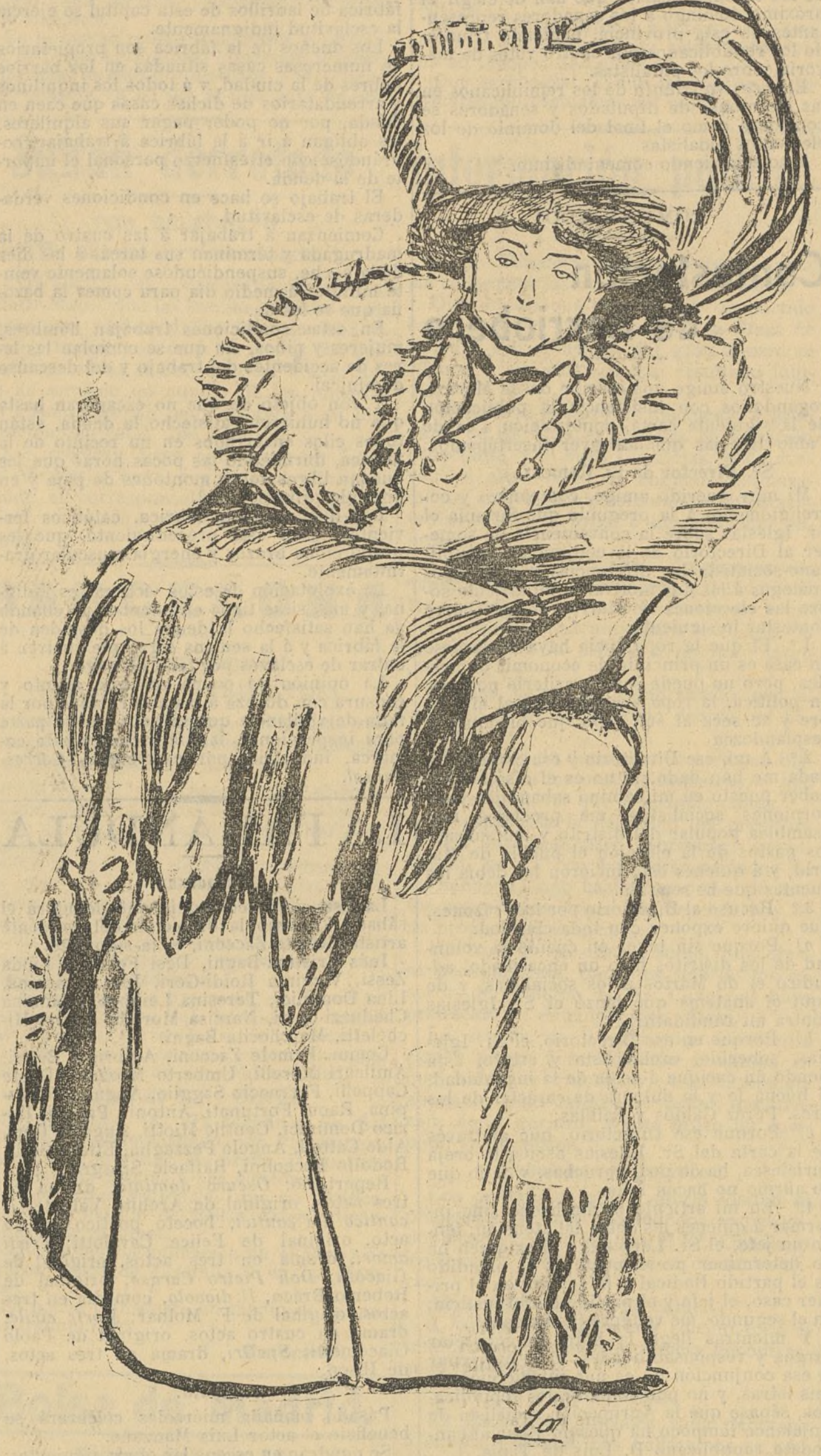
Y dijo Dios: «Creced y multiplicaos».