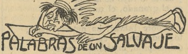
PALABRAS DE UN SALVAJE

También hubo reyertas, con sus correspondientes heridos y contusos, en otros distintos puntos de la ciudad.