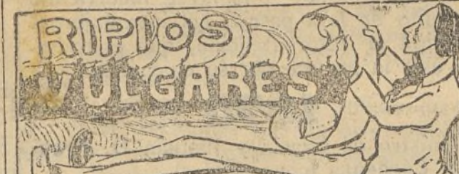
¡PAZ Á LOS MUERTOS!