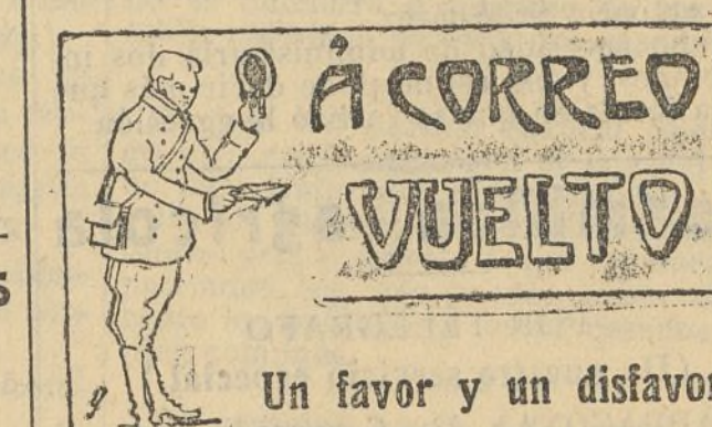
Un favor y un disfavor.